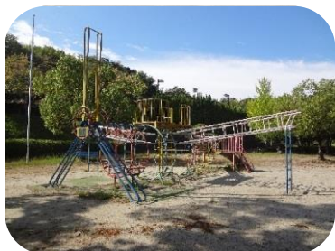
■ひこうき型複合遊具