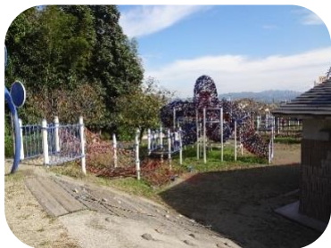
■複合遊具チューブトルネード