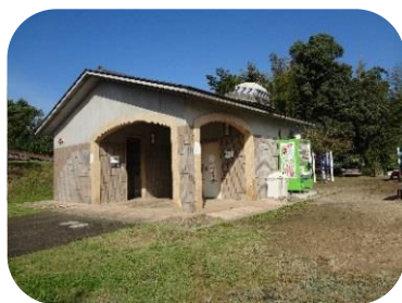
■花見山中央トイレ