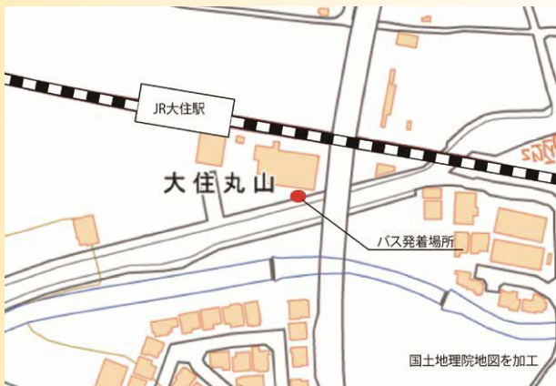
シャトルバス発着場所