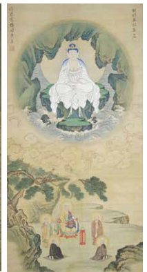
三十三観音図 (中尊)