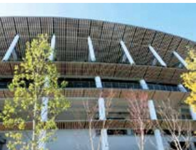
東京オリンピック2020の舞台となったことで記憶に新しい国立競技場も設計

市長 このテラスの完成により、甘南備山から一休寺、そして1千600年前の天理山古墳群など歴史・文化をつなぐ「周遊ルート」が見えてきます。点在する歴史スポットをワクワクしながら巡る滞在型の楽しみ