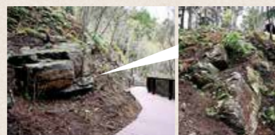
「白石」(写真④)と呼ばれる巨石を間近に見ることができるデッキ。展望テラスの真下にある階段で行き来できます。