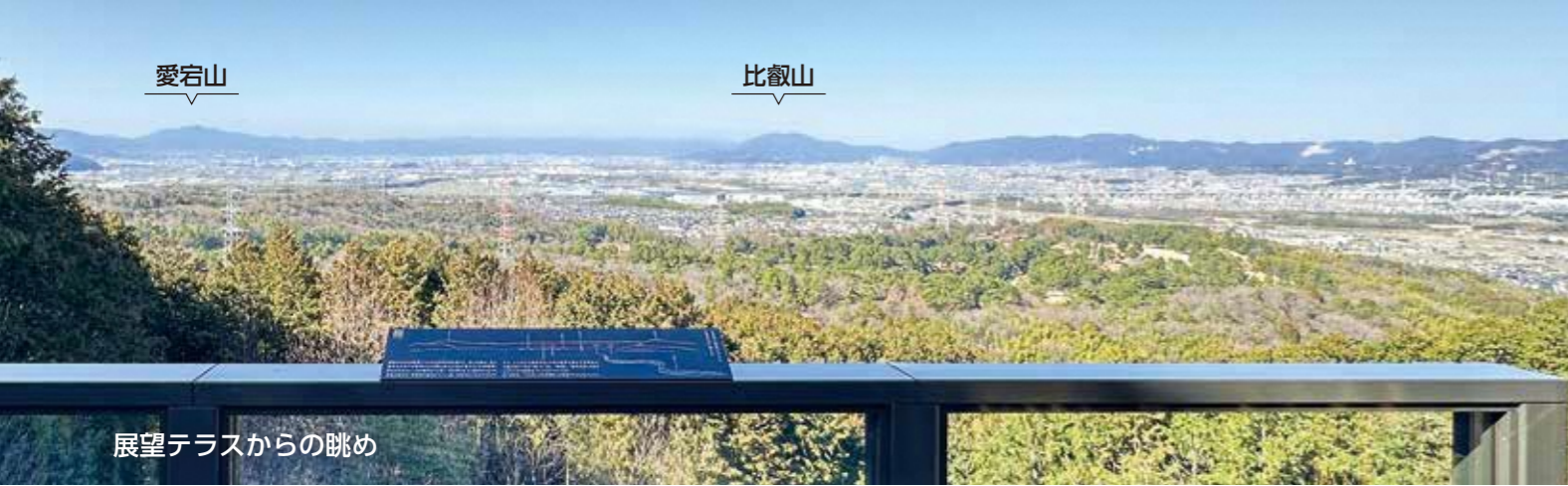
展望テラスからの眺め