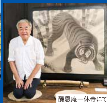
酬恩庵一休寺にて