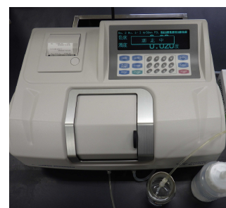
色度・濁度測定器