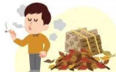
可燃物の近くの喫煙