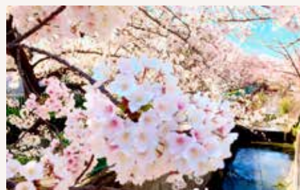
春には桜が咲き誇る虚空蔵谷川

次世代のために役員の負担軽減を図りながら、ごみステーションの改修・防犯カメラの設置・公民館の維持管理など、一歩ずつ着実に進めています。自治会はあくまでボランティア活動です。だからこそ、「入らなければならない」から「入りたくなる」存在になれるよう、今後も模索していきます。