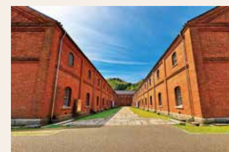
舞鶴赤れんがパーク

申込・問合せ先＝市平和都市推進協議会事務局 (総務室内、〒610-0393〈住所不要〉、☎64-1337、FAX 63-4781)