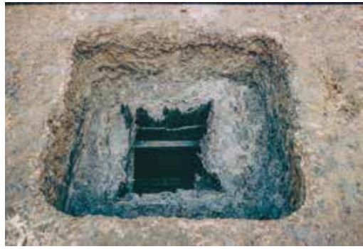
隼人の盾を使った井戸の遺構