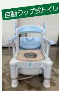
自動ラップ式トイレ

災害時には、生活に必要な電気・ガス・水道などがストップする恐れがあります。市は、これらの際にも対応できるよう、今年度、自動ラップ式トイレ・トイレ用テント・蓄電池を新たに購入しました。各家庭でも、災害が起こった時を想定し、必要な物を用意しておきましょう。避難する際にすぐ持ち出せるように、両手が空くリュックなどに詰めて準備することをお勧めします。