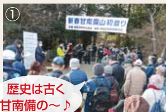
① 歴史は古く 甘南備の〜♪

問合せ先=文化協会 (中央公民館内、☎29-9118 <午前9時~正午。日・月曜日、祝日を除く>)