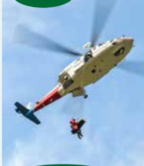
ドクターヘリ展示