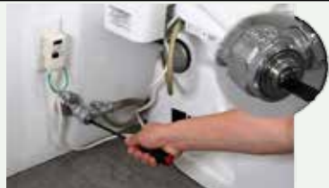
止水栓（製品評価技術基盤機構より）