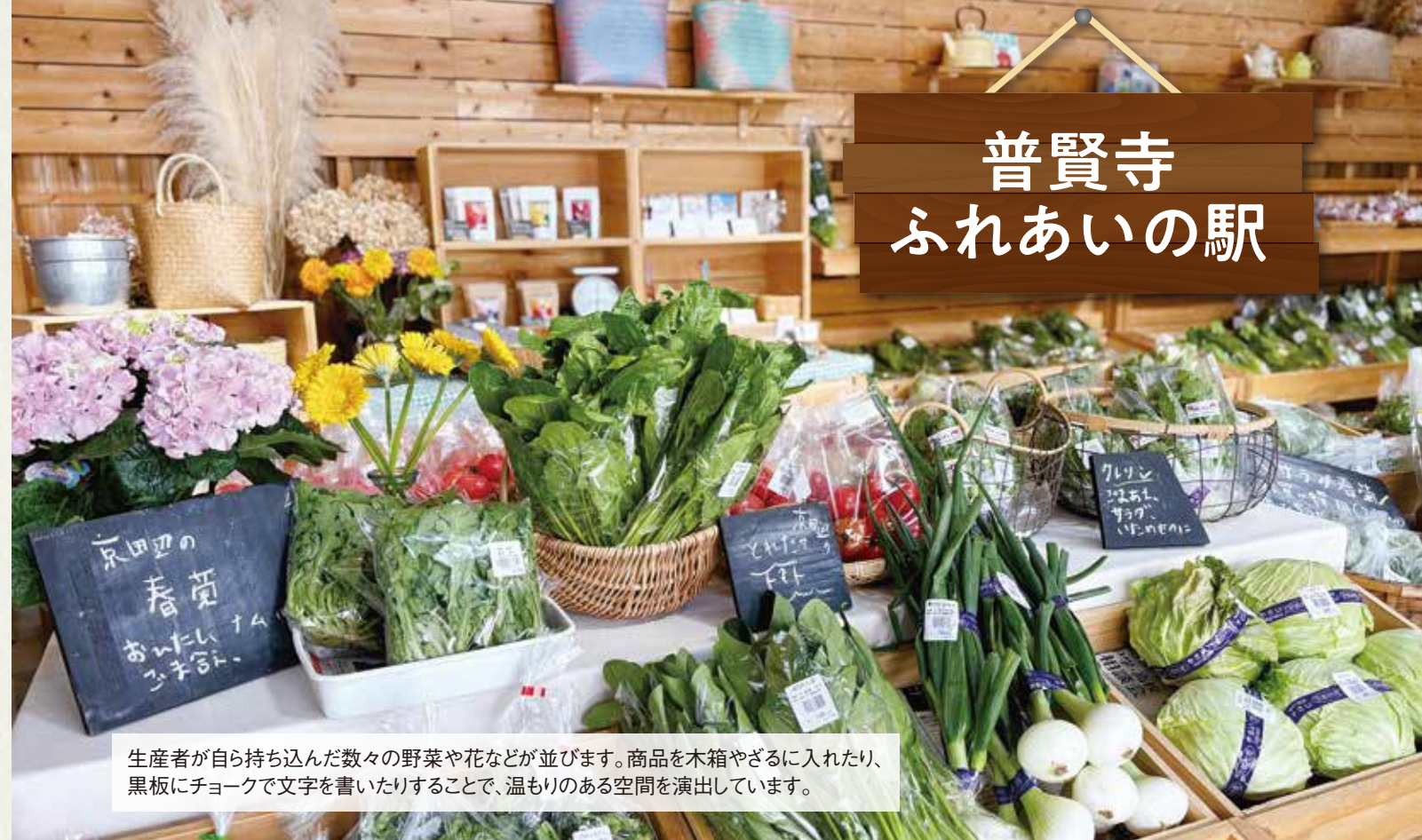
生産者が自ら持ち込んだ数々の野菜や花などが並びます。商品を木箱やざるに入れたり、黒板にチョークで文字を書いたりすることで、温もりのある空間を演出しています。

幅広い世代の方が気軽に立ち寄れて、さまざまな体験ができる地域の交流拠点をもっと広げていきたいです。