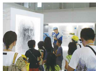
さまざまな大きさのチェーンで描かれたレオナルド・ダ・ヴィンチの顔