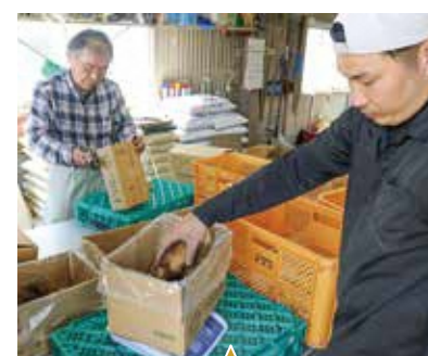
箱詰め作業も親子で協力。重さを計量しながら、決められた重量になるまで、個体を何度も入れ替えることも。

収穫したタケノコは作業場に持ち帰り、規格ごとに分別した後、保温性が高い袋を被せた箱に、見栄えも意識しながら一本一本丁寧に詰めていきます。その後、トラックで市場に向けて出荷されます。