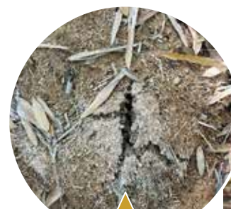
タケノコの目印となる地割れ

初夏は田植えなど多くの農産物の栽培が盛んになる季節です。 今号では、市特産の生産者や種類のほか、新鮮野菜を購入できる直売所を紹介します。