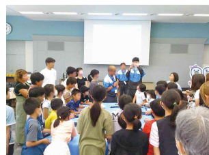
チェーンの組み立てを体験

問合せ先=▼(株)樺本チエイン京田辺工場・夏休み工場見学会事務局(☎64-5002) ▼産業振興課(☎64-1364)