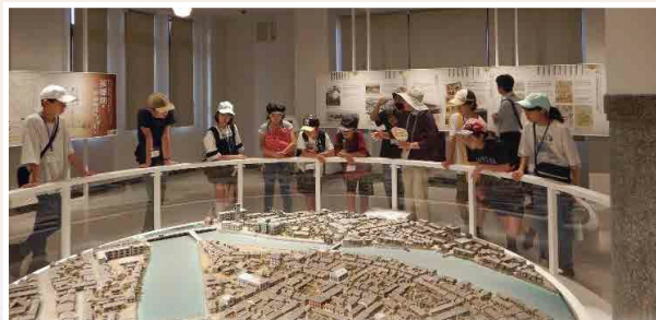
平和記念公園レストハウス(元大正屋呉服店・被爆建物)内の展示室