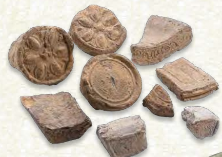
奈良時代 興戸廃寺瓦