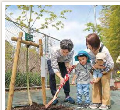
家族で記念樹に土を寄せる昨年の参加者