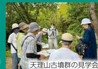
天理山古墳群の見学会

綴喜古墳群の保存活用計画の策定に向けて、市民向けの古墳見学会や古墳活用のアイデアを探るワークショップを開くなど、皆さんと一緒によりよい古墳の生かし方について考えています。