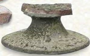
奈良時代 須恵器（高杯）の破片