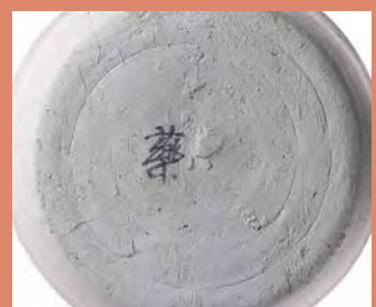
墨書土器 「薬」と墨で書かれている土器。 井戸から出土しました。