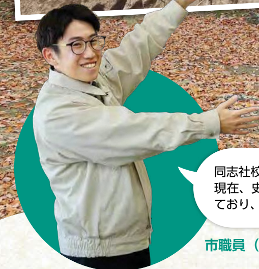
同志社校地内にある田辺天神山遺跡は、現在、史跡公園として保存・展示されており、いつでも自由に見学できます。