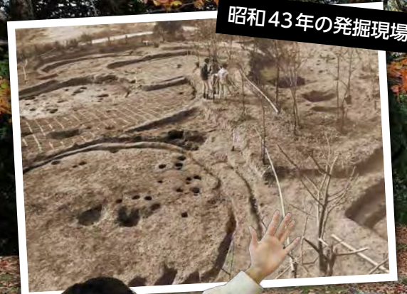
昭和43年の発掘現場