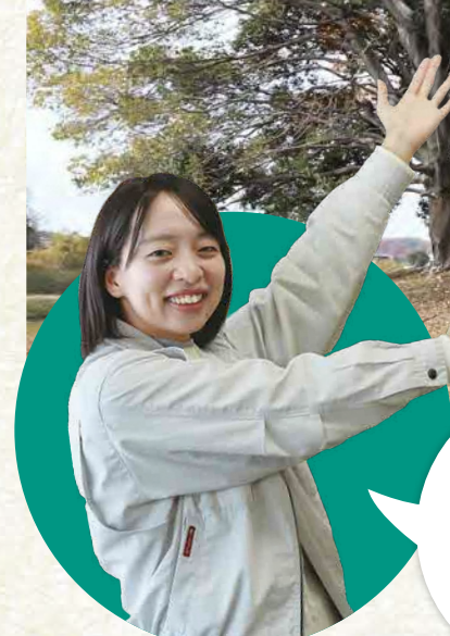
市職員(文化財担当)

大住八王寺にある全長66mの前方後方墳で、別名チコンジ山(智光寺山)とも呼ばれています。墳丘の周りには長方形の周濠(しゅうごう)が巡っています。昭和49年に本市で初めて国史跡に指定されて以来、標識や案内板の設置、盛り土、芝張りなどの整備を進め、今日までその姿をとどめています。令和6年に史跡指定50周年を迎えました。