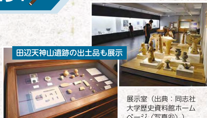
田辺天神山遺跡の出土品も展示

同志社が保有する歴史文化遺産を一般公開しています。 開館時間＝午前10時～午後4時（午前11時30分～午後0時30分を除く） 休館日＝土・日曜日、祝日、2月3日（月）～10日（月） 場所＝同志社大学京田辺キャンパス知真館2号館1階 問合せ先＝同志社大学歴史資料館（☎65-7255）