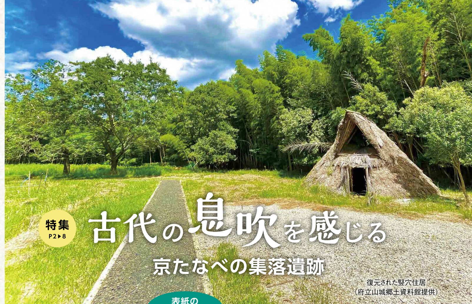
復元された竪穴住居