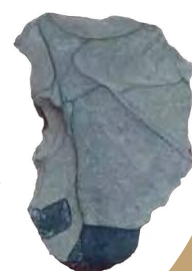
石核…石を割って石器を作るための本体。核となる石のこと

後期旧石器時代（3万年～1万3千年前）のものと考えられるサヌカイト製の石核。昭和54年、天王高ヶ峯（朱智神社の東側付近）から出土しました。