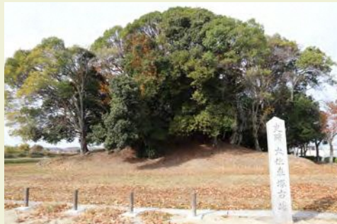
大住車塚古墳 (史跡指定50周年パネル展示)