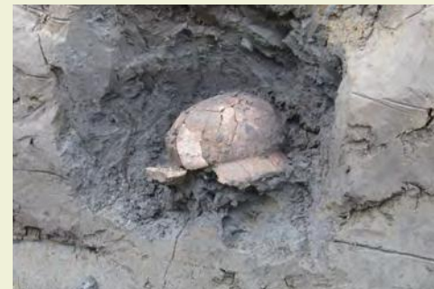
門田遺跡 土師器甕