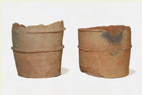
天理山3号墳 円筒埴輪