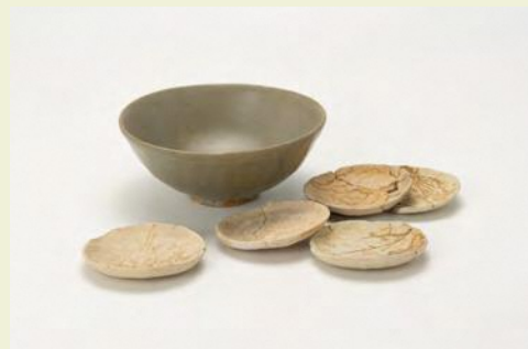
門田遺跡 青磁椀・土師皿