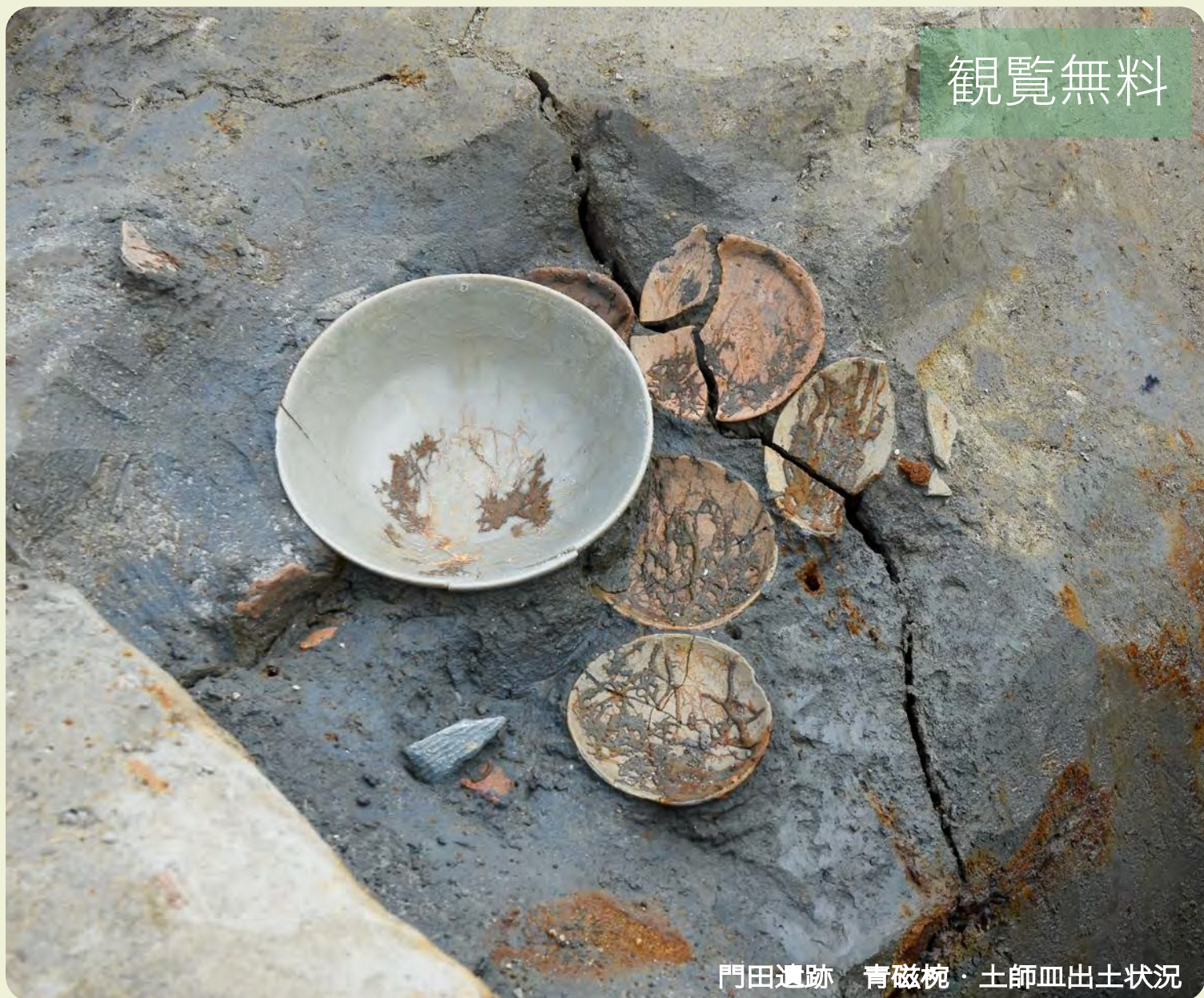
門田遺跡 青磁碗・土師皿出土状況