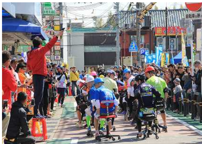
【いす1-GPスタートの風景】

事務いすレース発祥の地京田辺市において、 いす1-GP京田辺大会を開催し、まちのにぎわいを創出します。