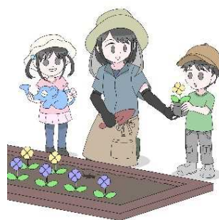
みんなで花壇をつくろう！

公園を地域の交流拠点と位置付け、地域活動や市民交流の場として活用いただき、市と協働で公園の管理も行うなど、地域コミュニティの醸成を図るものです。