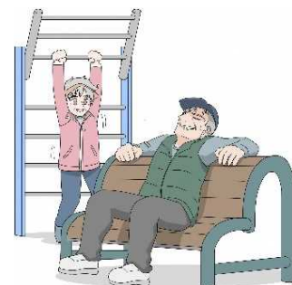
健康遊具で生き生きと！