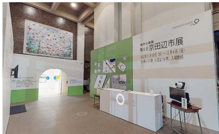
【「京田辺市展バーチャル美術館」の様子】

京田辺市展は、芸術家の創作活動の振興を図るとともに、市民に鑑賞の機会を提供し、本市の文化の発展に寄与することを目的に開催しています。「U18審査員賞」を設定し次世代を担う若者世代の関心につなげることや、デジタルコンテンツを利用して会期後も鑑賞できる機会を設けるなど、文化芸術を身近に感じられる場として市展を活用します。