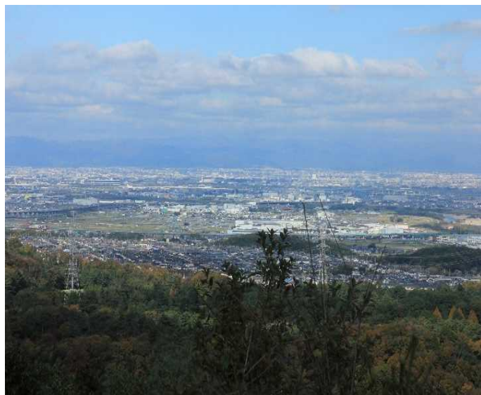
【甘南備山から京都市街地を眺望】

また、 いす1GP や ツアー・オブ・ジャパン京都大会 など多彩なイベントも魅力のひとつです。これらの地域資源を生かし、 市民と観光客が「ひとやすみ」 できるまちづくりを行っています。