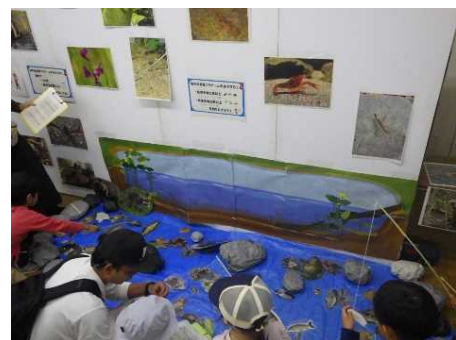
【出展ブース一例】 (外来・在来生物釣り)

来場者を対象とした環境にまつわるノベルティグッズを作成し、環境フェスタで配布します。