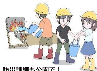
防災訓練も公園で！