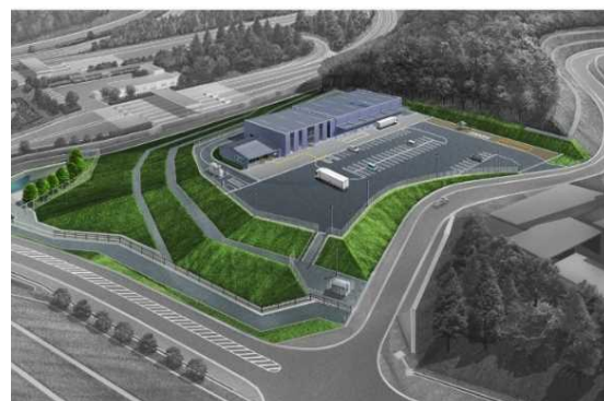
防災広場完成イメージ

京奈和自動車道田辺西IC付近において、災害時における安全な避難、災害時の広域的な救援活動拠点や物資集配機能を持つ防災広場の整備を進めており、今年度から建築工事に着手し、令和8年度中に完成する予定です。