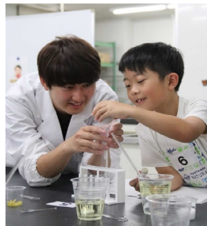
【サイエンスアカデミーの様子】

大学連携の窓口機関として「大学連携ディスカバリーベース」を設置し、市内をフィールドとした教員や学生の研究活動等をサポートしています。