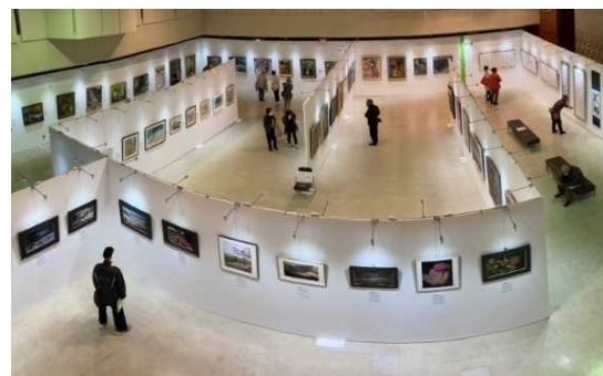
【「京田辺市展」の様子】