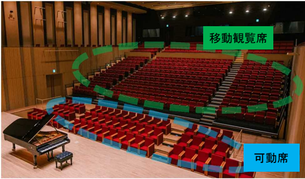
スターツおおたかの森ホール(千葉県流山市) 客席数 506 席 1F 移動観覧席 280 席、可動席 58 席、車椅子席 4 席 2F 固定席 156 席、多目的室（親子席）4 席×2