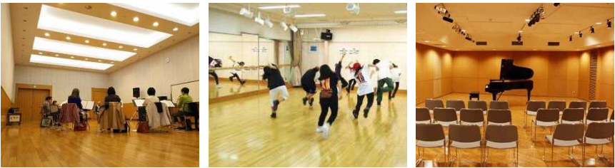
多目的室の利用イメージ