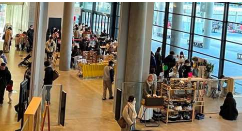
おにクル (大阪府茨木市) クラフト作品の販売やワークショップ