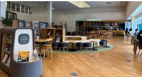
海南 nobinos (和歌山県海南市) カフェと一体となった読書スペース

～“憩いの場”としてのサードプレイスから“つながり”により文化活動が創造されるフォースプレイスとしての「ひろば」～