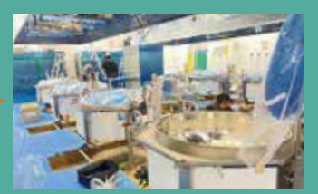
今年2月 おかずを作る釜などの器具を搬入

施設の屋根には太陽光パネルを設置しており、非常時には施設内の補助電源として利用することもできます。