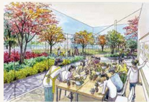
農と緑に触れ合えるスペース