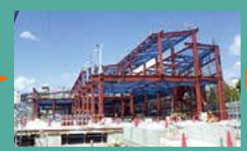
昨年9月 骨組みにより見え始めた建物の姿