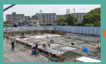
昨年6月 土地の造成が完了し、建物の柱の基礎を準備中