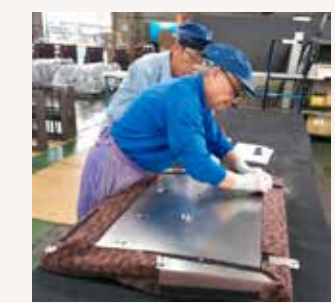
座席の背もたれにシワが出ないように表皮材を貼る