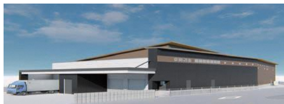
（仮称）学校給食センターのイメージ