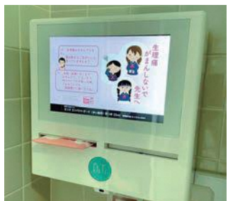
生理用ナプキンの配布装置

トイレ利用者については鉄道駅の利用者を中心とし、まずは駅構内に設置すべきと考えている。JR西日本に対して設置要望を行っており、オストメイトトイレについては近隣の公共施設に必要かどうか、周知の看板等の設置を含めて検討してまいりたい。