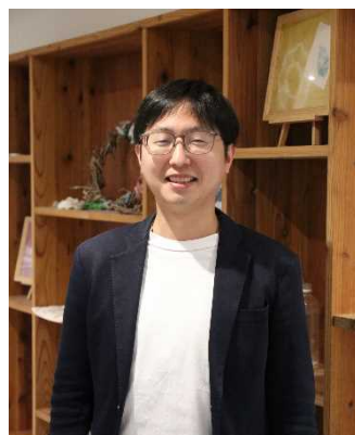
▲社会福祉法人宇治福祉園 みんなのき三山木こども園 園長

さまざまな分野における男女共同参画を推進するため、性別にとらわれず個性を発揮し、活躍している人を紹介します。