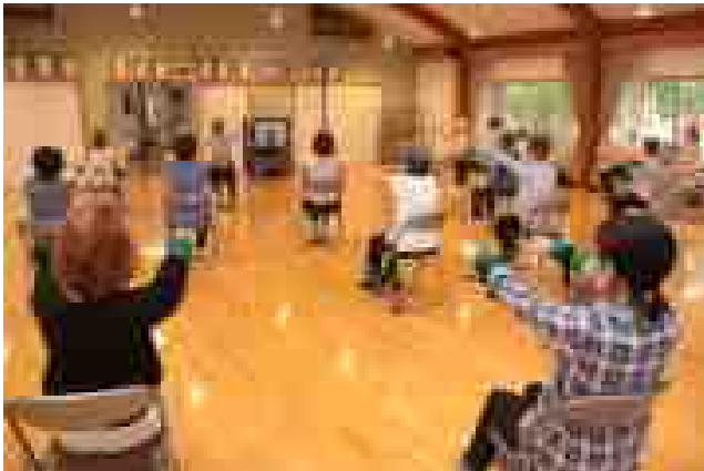
～高齢者の居場所づくり活動～