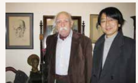
スペインを訪れ、モンポウの友人から色々貴重な話を伺いました。

※音楽によるアウトリーチとは 音楽の楽しさや楽器などを知ってもらうため、学生が小学校の授業で音楽公演を行う事業。平成30年度から毎年行っています。