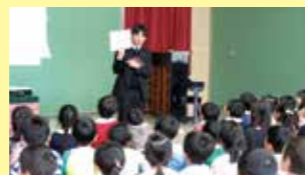
小学校教員による授業