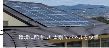
環境に配慮した太陽光パネルを設置