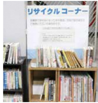
リサイクルコーナー

子ども向けの絵本に囲まれたじゅうたんのスペース。靴を脱いで、楽な姿勢で読書をしたり、親子で紙芝居を楽しんだりできます。