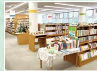
北部分室(北部住民センター内、☎63-0499)