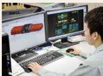
サイレンを内蔵した警光灯を3次元CADで設計開発

仮想空間に立体的な形状が作れる3次元CADを使って設計を行うほか、コンピューターで制御された機械で加工を行うことで、ほぼすべての製品を、企画から設計開発・製造まで自社で行っています。