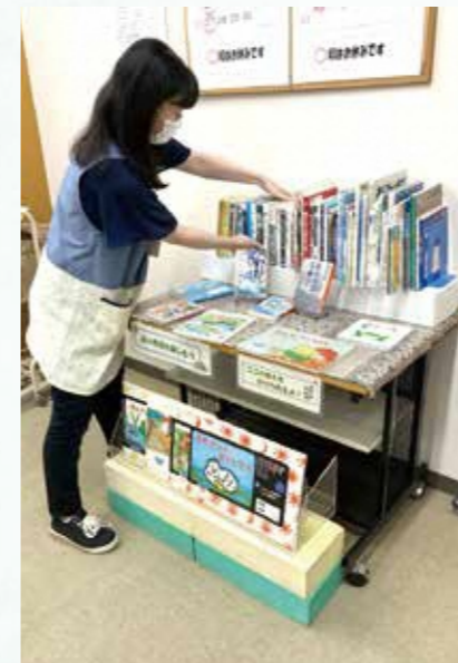
中部分室の展示コーナー