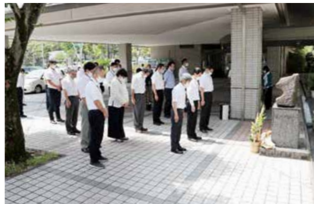
8月6日・9日は、広島で被爆した屋根瓦が収められた「平和の塔」の前で、黙とうを行います。