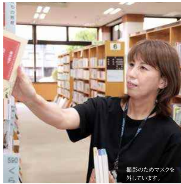
撮影のためマスクを外しています。

選んだ3冊の本を、中が見えない袋に入れて貸し出したりする企画などを通して、皆さんと、未知の分野の本をつなぐための仕掛けも行っています。 新しい本と出会うためには、今まで興味なかった本が並ぶ棚の前を歩くことをお勧めします。大人の方は、子どもの本のコーナーの本を眺めてみるのも楽しいと思います。思わぬ発見や、人生を変える一冊に出会えるかもしれませんよ。