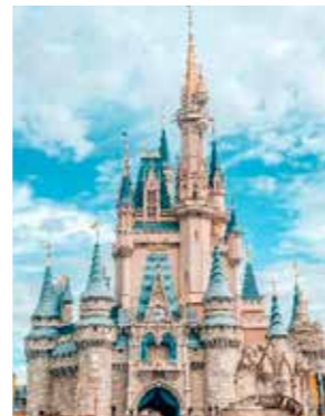
マジックキングダム内にあるシンデレラ城