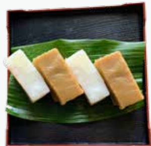
小麦粉(米粉) ういろろ

2つの食材だけで、レンジで手軽に和菓子が作れます。砂糖を黒糖に代えたり、水を牛乳や豆乳に代えたり、さまざまなアレンジができます。