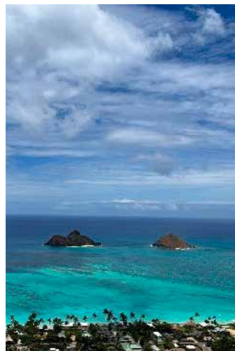
ラニカイビーチ (オアフ島)

日本人にも人気のあるハワイもお薦めで、青い海と白い砂のビーチがとてもきれいです。8つある島のうち、私は、オアフ島とカウアイ島に行ったことがあります。州都であるホノルル市があるオアフ島は、政治・経済・観光の中心で、ショッピングセンターやホテルがたくさんあります。島北部にあるラニカイビーチは、波も穏やかで小島までカヤックで行くことができます。また、カウアイ島は、自然豊かで「庭園の島」として知られています。私は、川をカヤックで渡り、森を抜けたところにある「秘密の滝」を家族で見に行ることがありますが、その迫力に圧倒されました。簡単な紹介でしたが、アメリカにはわくわくするアトラクションが集結した遊園地や、ゆっくり自然を楽しめる場所など、さまざまな観光地があります。アメリカへ旅行する際は、ぜひ、今回紹介した場所に行ってみてください。