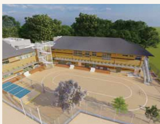
ICTタグを用いた登降園管理システムをはじめ、地球環境にやさしい太陽光発電やLED照明などを導入します。また、府内産木材をふんだんに使用するため、木の温もりを感じられる園舎です。

大住幼稚園は、園舎の老朽化や保育ニーズに対応させるため園舎を建て替え、令和5年4月に、(仮称)大住こども園として開園します。同園は、本市初となる公立の幼保連携型認定こども園として幼稚園と保育所の機能を併せ持ち、一時保育や子育て相談などを行います。小・中学校との連携や地域とのつながりを充実させた魅力ある園を目指します。なお、幼稚園枠の対象は、大住・桃園小学校区に在住する子どもに限ります。