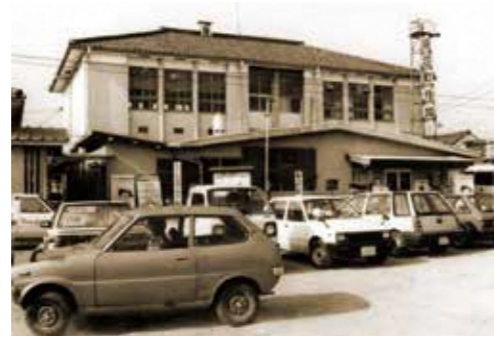
旧田辺町役場の跡地に立地

2階にある書庫には、利用頻度が少ない本を中心に保管しています。電気式の棚を活用することで、限られたスペースを無駄なく使用し、約15万冊の本を保管しています。普段は公開していませんが、毎年12月に開いている「書庫公開 DAY」では、一般公開しています(要申込)。