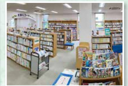
中部分室(中部住民センター内、☎64-8833)

開館日時=午前10時~午後6時(土・日曜日は午後5時まで)。月曜日・祝日・最終金曜日は休館です(土・日曜日の祝日は開館)。 ※予約本の受け渡し・返却は、南部まちづくりセンターでも行っています(火~土曜日午前10時~午後5時)。また、駅ナカ案内所でも返却できます(午前9時~午後5時)