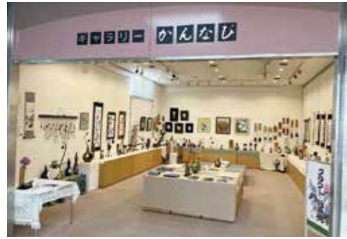
ギャラリーかんび

出入口近くにある展示スペース「ギャラリーかんび」は、市民や団体の皆さんの芸術作品などを発表する場として利用されています。8月の予定は、26ページをご覧ください。