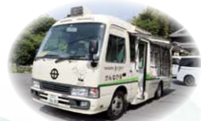
トヨタコースター(マイクロバス)改造車

かり顔なじみになり、子どもたちの会話の中で興味のある本を覚えてくださり、次の巡回時に、目当ての本を持ってきてくれます。とても親しみやすく距離の近い図書館といった印象です。皆さんも、ぜひ、利用してみたいかがでしょうか。