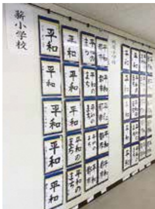
児童・生徒の力作が並ぶ書道展

なお、8月11日(祝)に開く「平和のつどい」では、平和をテーマにした講演・平和書道展入賞者への表彰などを行います。新型コロナウイルス感染症拡大防止のため、関係者のみで行う予定です。当日の様子は、9月1日(木)から市公式YouTubeで公開します。