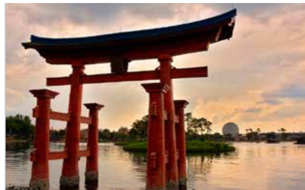
エプコット内に再現された厳島神社