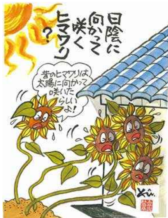
【ヒマワリのUV(紫外線)対策】