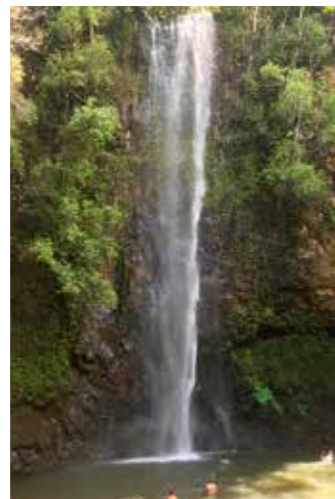
秘密の滝 (カウアイ島)