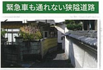
緊急車も通れない狭隘道路