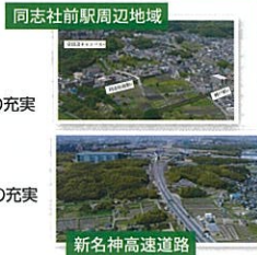
同志社前駅周辺地域