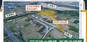
田辺排水機場、新西浜橋門