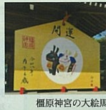
榎原神宮の大絵馬

京田辺市では、枚方市との可燃ごみ広域処理施設の稼働をはじめ、複合型公共施設計画など、数多くのプロジェクトが進められています。また、地域福祉の充実や「子どもまんなか社会」の実現に向けた施策も着実に進んでいます。これもひとえに先人のご尽力の賜物です。