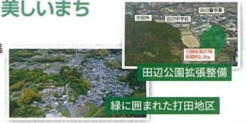
田辺公園拡張整備