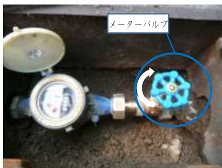
リングバルブタイプ 十数回まわします