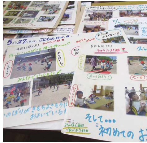
日々掲示されているフォトアビール(松井ヶ丘幼稚園)

が入所にいたらなかった子どもと理由は。 市長 公立幼稚園の果たしてきた役割を否定するものではないが、現在の保育ニーズ、幼稚園ニーズのあり方を見極めて、何が市民にとって一番重要なニーズになっているのか把握し、検討を進める。 教育長 ①幼稚園の魅力は今後もさらに市民、保護者の方に積極的に発信していく。 子ども政策監 ②松井ヶ丘幼稚園は現施設で継続していくが、園児が減少したら慎重に検討する。パブリックコメントの意見を精査する中で市の考えを示す。保育所入所にいたらなかった子どもは21年度は138人。特定施設のみ希望されたことや、復職の意向が未定などが理由 市長 子育て用品だけではなく防災意識の向上や非常時のための用品選定をしてきた3年度に生まれたお子様には3カ月健診の際に、そして2年度のお子様には直近の健診で随時配布する。 市長 市内の若者は結婚に経済的な負担・不安がある。新婚生活支援を実施すべき。 企画政策部長 新婚世帯への経済的支援は考えていないが、今後の人口動態、動きを見る中で提案を参考にします。 市長 親族が亡くなった後の手続きは、マイナンバーカード