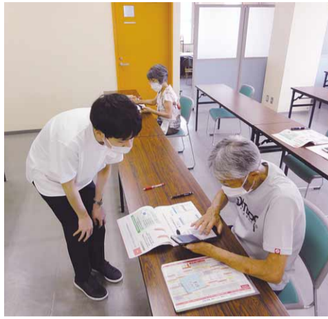
京田辺市シルバー人材センターで行われたスマホ教室の様子(令和3年7月)

赤ちゃん応援事業の進捗は 答 子育て用品を検診時に配布 向川 弘 議員 (公明党)