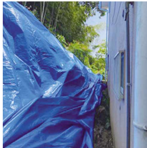
大雨被害で崩れた裏山の対応状況

京都市が近隣市町で最も多くのふるさと納税寄附金額の増収が実現できた理由として、ふるさと納税市場の拡大と返礼品目数の大幅な増加と納税ポータルサイト掲載数を拡張させたことにより、ヒット商品であるお節料理が発掘されたことが挙げられるが、今年度、本市はどのような増収戦略を考えているのか。 市長 業務の一部を民間に委託するとともに、民間ポータルサイトをさらに追加し、寄附の増収等を図っていきたい。 市長 返礼品事業者の募集時には、飲食店を始め多くの市内事業者に応募をいただけるように努める。 市長 本市の魅力的な商品である一休品を返礼品にする 30〜40品目の増加を見込むことができ、全国へPRすることも可能であると考えるが、市の考えは。 総務部長 国の明確なルールに則って検討する。 市長 過去3年間の本市の流出額を問う。 総務部長 平成29年度78億80万5000円、30年度1億1025万9000円、令和元年度1億4897万2000円が流出している。 市長 ふるさと納税を伸ばしていくという中で、これだけの税収が流出しているという現状、早急に対策を進めていただきたい。 総務部長 企業版ふるさと納税など、議員の提案を今後の参考にしたい。