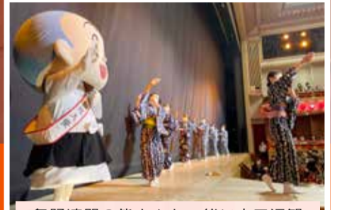
舞踊連盟の皆さんと一緒に京田辺観光大使「一休さん」も「田辺音頭」を披露しました。