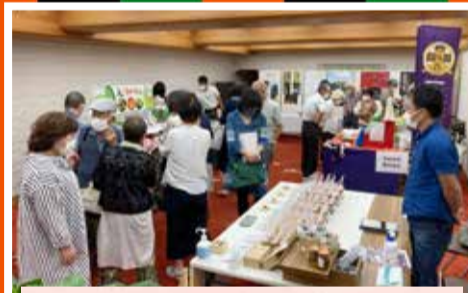
期間中の8日間、南座ロビーでは、本市の観光・物産などをPRし、多くの人でにぎわいました。