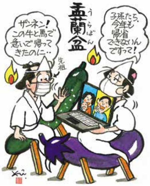
【お盆・先祖の会話】