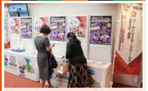
本市がハンドボール競技の会場となる「ワールドマスターズゲームズ2021関西」（来年5月開催）のPRブースでは、チラシに手を伸ばす人の姿も。