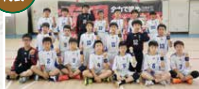
第32回大会の3位入賞チーム。楽し みながら「全国優勝」を目標に練習に励 んできました。「疾風迅雷」の横断幕の ように松井ヶ丘旋風を巻き起こします。