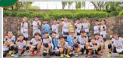
第31回大会の優勝チーム。強みであ る攻撃力・シュート力・チームワークを 武器に、全国制覇を目指します。