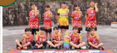
第32回大会の優勝チーム。チームワー クの良さが特徴の5年生が多いチーム。 「フルドライブ TKG (TaKiGi)」を合言 葉に、最初から最後まで全力で駆け抜け ます。