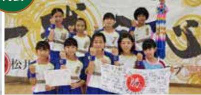
第32回大会は決勝で涙をのみ準優勝。 「一球全心」の横断幕のように、すべて の人の思いを背負い、心を1つにして全 力でプレーします。