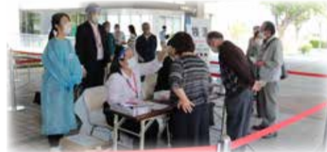
コミュニティホールでの集団接種の様子

新型コロナワクチンに関する予約・問い合わせなどの対応を円滑に行うため、ナビダイヤルの導入・電話回線の増設を行いました。また、7月16日(金)からはウェブ予約を始めます。詳しくは、市ホームページをご覧ください。