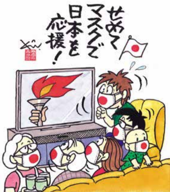
【コロナ禍のオリンピック】