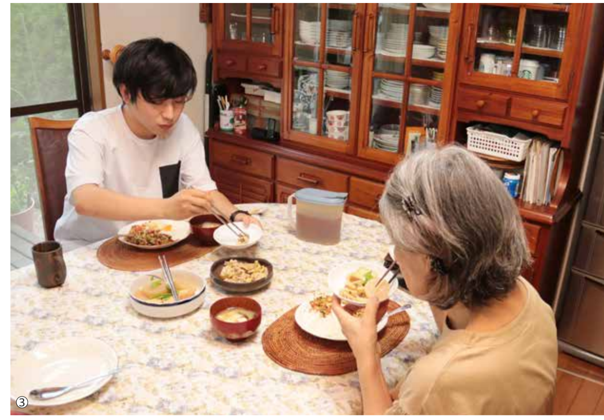
ともずみ 高齢者と若者の「共住」京田辺モデルが4組誕生