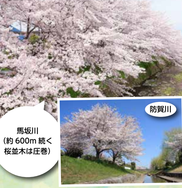
馬坂川(約600m続く桜並木は圧巻)