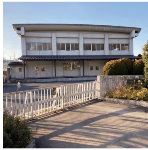
近隣の学校の給食センター