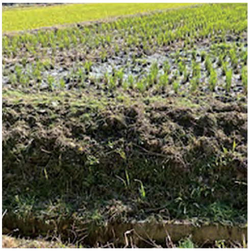
イノシシに荒らされた田畑

り組みを計画に反映させたい。 問 小・中学校へのタブレット導入後の教員や学校間での連携は。 教育部長 現在ICT教育推進ワーキング部会などで研修や研究の計画を進めている。活用事例の交流を通して、各校での円滑な導入に努めたい。 問 新東沢公園拡張整備のスケジュールは。 建設部長 既に造成工事を完了し、現在公園内の排水路整備を中心に工事を進めている。令和3年度上半期には公園の整備を完了させたい。 問 市道長尾谷大久線歩道拡幅について。 建設部長 車道と歩道の幅員の見直しに向けた測量・調査・設計を進めている。3年度には工事に着手したい。