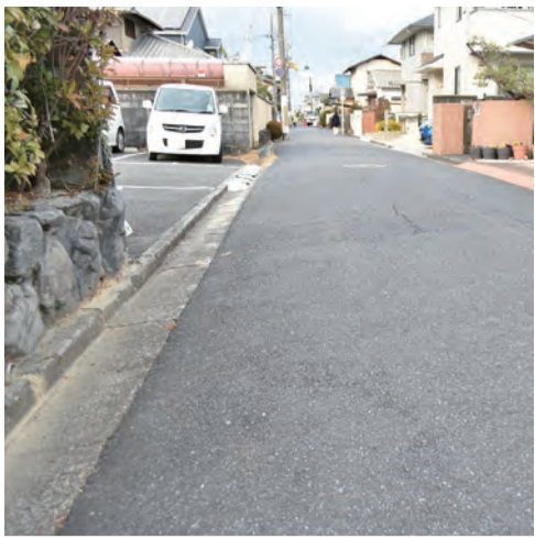
新田辺東住宅の道路