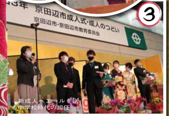
新成人へエールを送る 中学校時代の担任