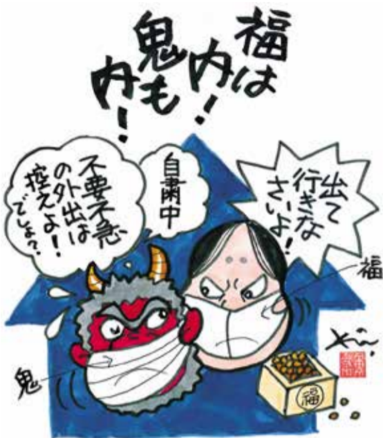
【緊急事態宣言中の節分】