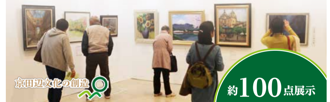
京田辺文化の創造