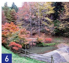
6 貯水池 Reservoir

スギ科の落羽松（ラクウショウ）の木の根が、呼吸をするために空中に伸び出たものです。酸素が乏しい泥中などに生育する植物にみられ、気根とも呼ばれます。