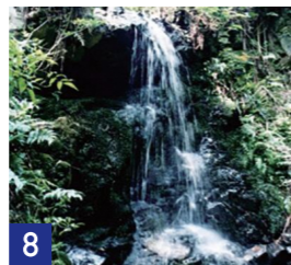
8 吉やんの滝 Waterfall of Yoshiyan

北は京都市から、南は同志社大学まで京都盆地を一望できます。晴れた日には比叡山、愛宕山（あたごやま）、京都タワーが見えます。