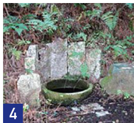
4 雨乞いの井戸 Well for Rain-making

村人が豊作を祈った場所として、天照大神（あまてらすおおみかみ）などが祀られています。境内からは、京田辺市の中心市街を見渡せます。