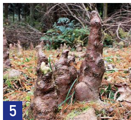
5 呼吸根 Respiratory Root

スギ科の落羽松（ラクウショウ）の木の根が、呼吸をするために空中に伸び出たものです。酸素が乏しい泥中などに生育する植物にみられ、気根とも呼ばれます。