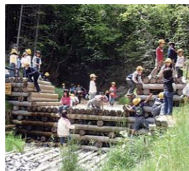
木製ダム Wooden Dam

竜王ヶ谷川にある中でもっとも大きな滝で、高さが5mあります。名前の由来はまだ分かっていません。雨乞いの小径沿いにはこの他に二の滝、三の滝があります。