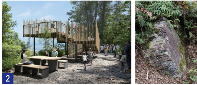
2 らせんのビューテラス/白石 Spiral Observatory / Shiraiishi

甘南備山の水の源である竜王の森にあります。貯水池周辺はトイレもあり、休息の広場になっています。水上デッキがあり、秋には紅葉に囲まれながら、池の上からの眺めを楽しめます。