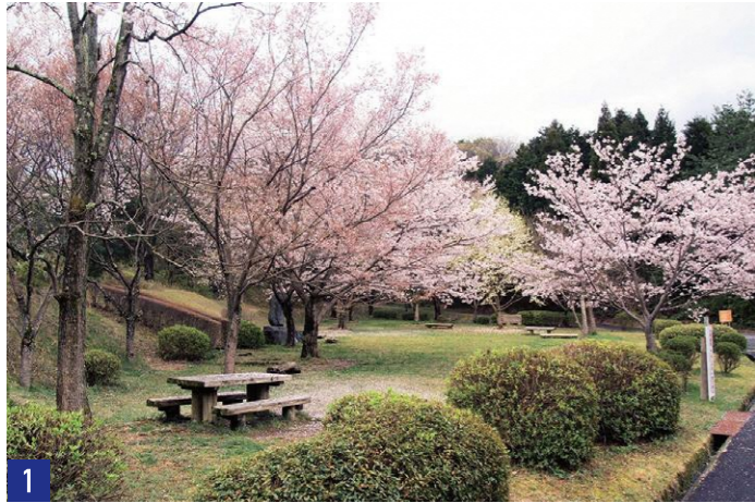
1 芝生広場 Lawn Field

春は桜、秋は紅葉を楽しめます。お弁当を食べたり、お花見をするのにぴったりです。広場内には、生活環境保全林整備事業が完成した記念として石碑が建てられています。