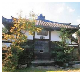
甘南備寺 Kannabi Temple

平成19年度から6基の治山ダムが京都府により整備されました。木製ダムとしては、旧登山道川・ゴミ谷川・イズマン谷川に各1基、南麓の谷川に2基整備されました。