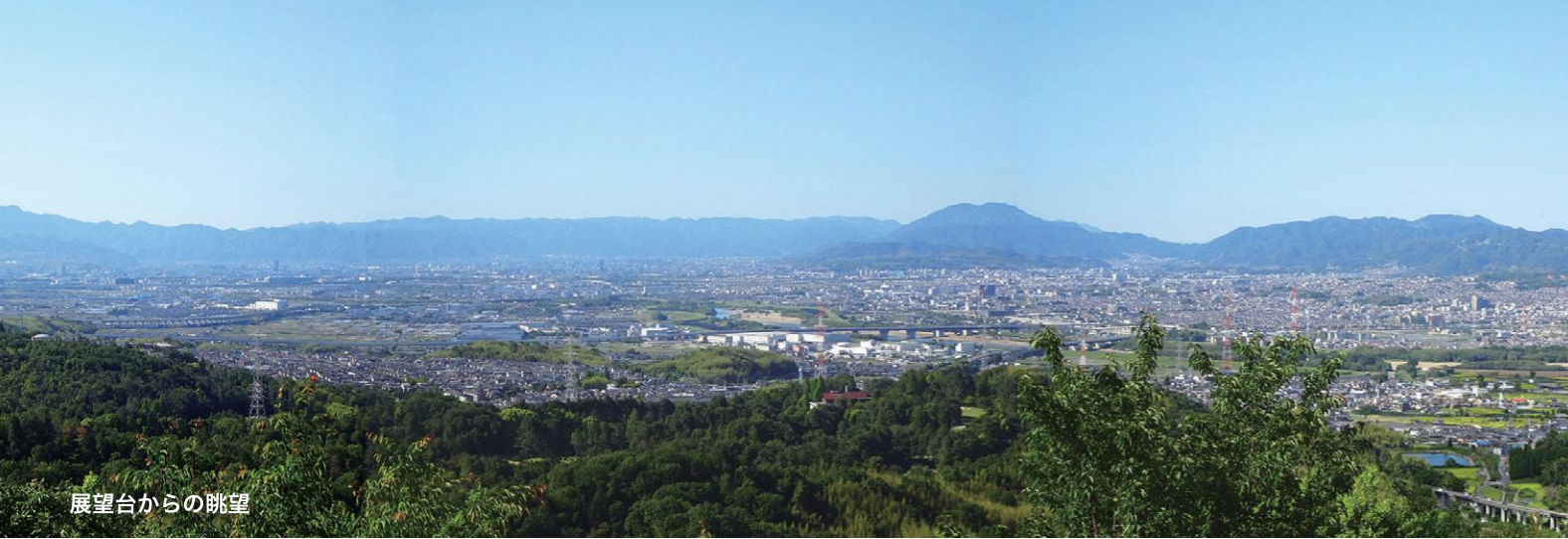
展望台からの眺望