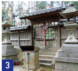
3 神南備神社 Kannabi Shrine

春は桜、秋は紅葉を楽しめます。お弁当を食べたり、お花見をするのにぴったりです。広場内には、生活環境保全林整備事業が完成した記念として石碑が建てられています。