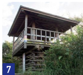
7 展望台 Observatory

また、三角点から北東約50m下方にある白石は、太陽の光の反射によって平安京建設当時の目印になったという説があり、平安京の中心線となる朱雀大路は、船岡山と甘南備山を結ぶ線上に決められたと伝えられています。