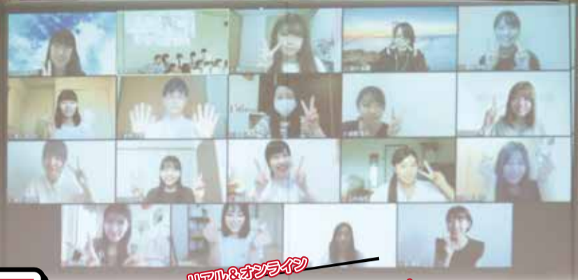
市×同志社×田辺高校連携事業