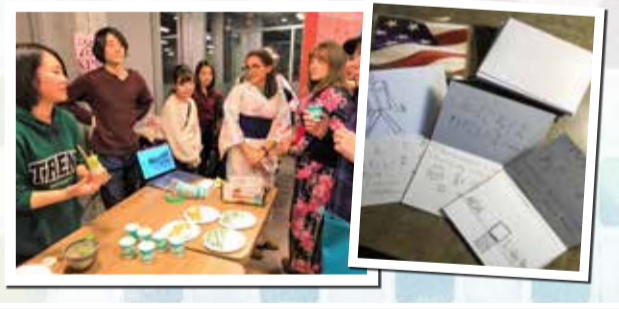
市では同志社女子大学と連携し、子どもたちが世界に目を向け多様な価値観を持つよう、平成30年度から、継続的に市民同士が交流できる海外都市の発掘に取り組んでいます。海外の大学への留学が必修である同大学学芸学部国際教養学科から、希望する学生を「京田辺市国際交流プロモーター」に任命し、本市の特徴や抹茶のお点前などを身に付けてもらうことで、留学先のまちと交流できる機会を作ってきました。市は今後も、海外都市との交流を発展させることで、本市の子どもたちの国際感覚や幅広い視野を養う機会を設ける予定です。同プロモーターの詳しい活動内容は、市ホームページで紹介しています。