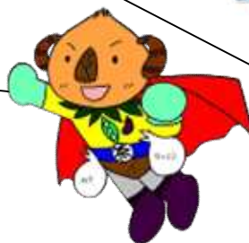
京田辺のヒーロー ぎょくろマン