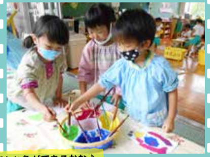
どんな色ができるかな！ (普賢寺幼稚園)