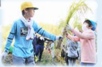
普賢寺小学校・幼稚園の子どもたちが、力を合わせて福刈りを体験

45分〜2時30分 2時40分から 場所▶普賢寺小学校 申込方法▶10月21日(水)まで 電話で普賢寺小学校に申し込んでください [問合せ先] ▼学校教育課(☎64-1392) ▼普賢寺小学校(☎65-0053)