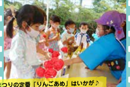
夏まつりの定番「りんごあめ」はいかが？ (新幼稚園)