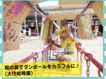
絵の具でダンボールをカラフルに！ (大住幼稚園)