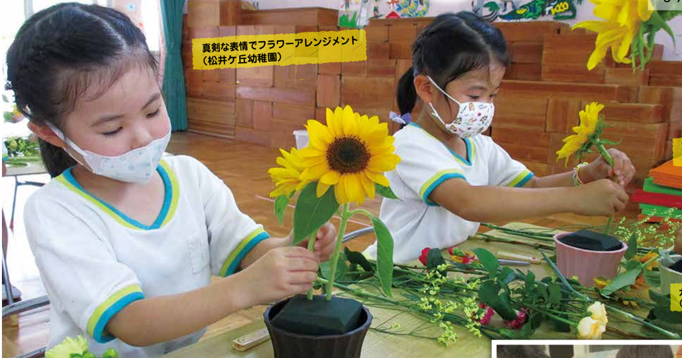
真剣な表情でフラワーアレンジメント (松井ヶ丘幼稚園)