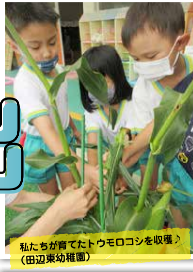
私たちが育てたトウモロコシを収穫！ (田辺東幼稚園)