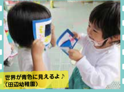
世界が青色に見えるよ！ (田辺幼稚園)