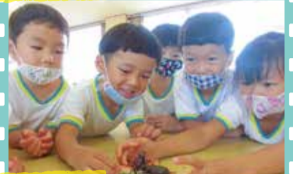
カブトムシの対決だ！ (三山木幼稚園)