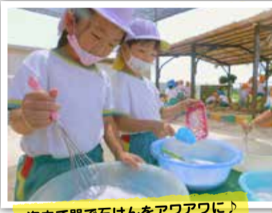
泡立て器で石けんをアワアワに！ (草内幼稚園)