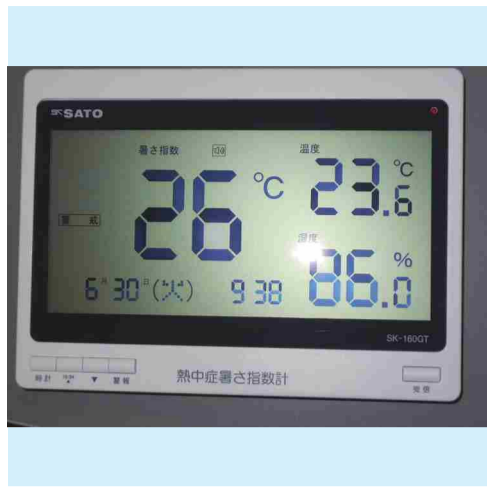
WBG T測定器 (熱中症暑さ指数計)