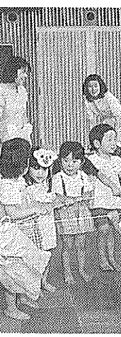
児童手作りの「大きな木」を子どもら (北部住民センター)