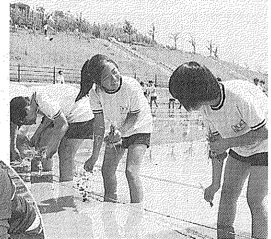
田植えを行う田辺中学校の生徒 (田辺敦ノ本)