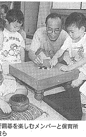
常盤苑で囲碁を楽しむメンバーと保育所入所児童ら

子育てを支援 「子育てで悩んでいるお母さんを支援したい」と大生児童委員協議会が6月15日に北部住民センターで開いた子育てサロン。同、子育ての相談相手もな