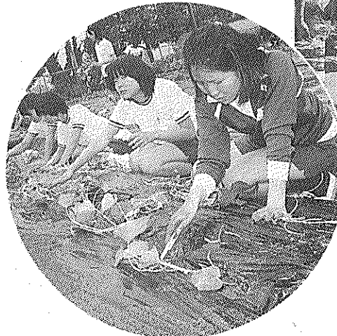
培良中学校横の畑でさつまいもの苗を植えていく生徒