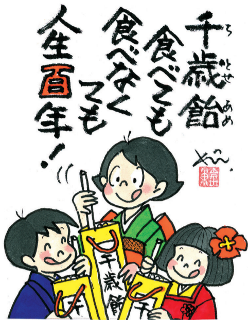
【長寿を願う千歳飴】