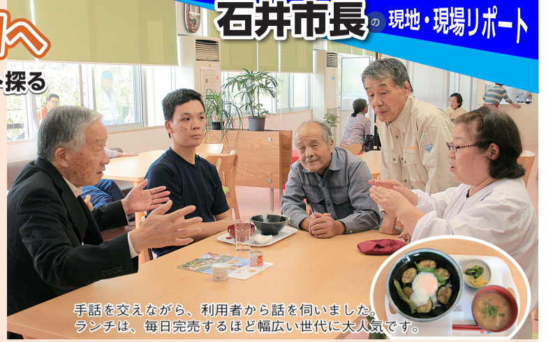
手話を交えながら、利用者から話を伺いました。ランチは、毎日完売するほど幅広い世代に大人気です。

市は、府農業総合研究所の跡地を取得し、「緑」と「農福連携」をテーマにした公園を整備する計画を進めています。 本市では、市中心部の田辺公園に、体育館・プール・テニスコートなどを整備してきました。今後はこの公園を広げ、スポーツ・レクリエーションだけでなく、緑や農に触れ合える体験型の交流拠点にするともに、障がいのある人が、能力と障がいの程度に応じて、いきいきと活動で