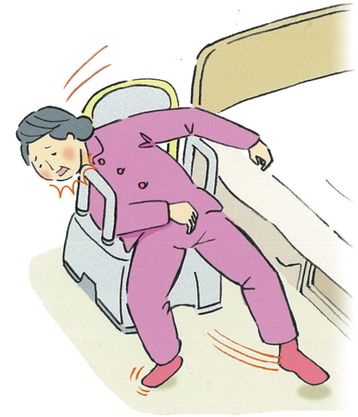
※参考：公益財団法人 テクノエイド協会 福祉用具ヒヤリ・ハット情報

つきましては事故防止のためにすき間のない製品と無償で交換させていただきます。ご使用中のお客様におかれましては、誠に恐縮ではございますが、ご使用製品のご確認をお願いいたします。対象製品の場合は、ご使用に注意していただきポータブルトイレ回収窓口までご連絡をお願いいたします。ご使用中のお客様には大変ご迷惑をおかけいたしますことを深くお詫び申し上げます。何卒ご理解とご協力をお願い申し上げます。