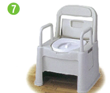
品名：ポータブルトイレ座楽 背もたれ型 HD 品番：SPTH