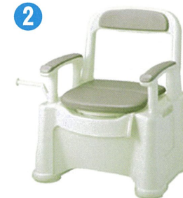
品名：ポータブルトイレ座楽背もたれ型 SP ソフト便座・便フタタイプ 品番：SPTSPS