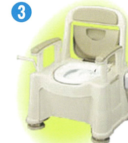
品名：ポータブルトイレ座楽 SP あたたか 品番：APTSP