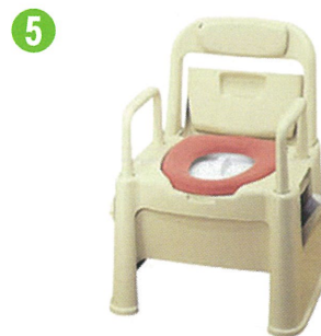
品名：ポータブルトイレ座楽 背もたれ型 品番：SPTSD