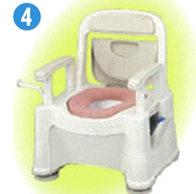
品名：ポータブルトイレ座楽背もたれ型 SP 小口径便座タイプ 品番：SPTSPMB