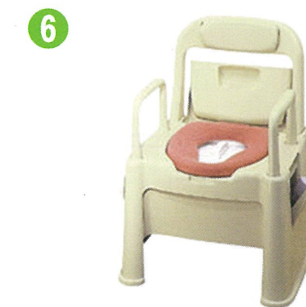
品名：ポータブルトイレ座楽 背もたれ型 SB 品番：SPTSB