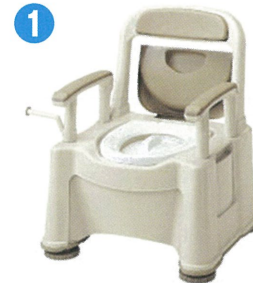
品名：ポータブルトイレ座楽背もたれ型 SP 品番：SPTSP