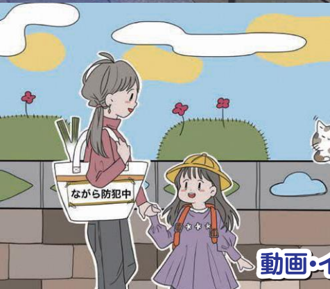
動画・イラスト制作