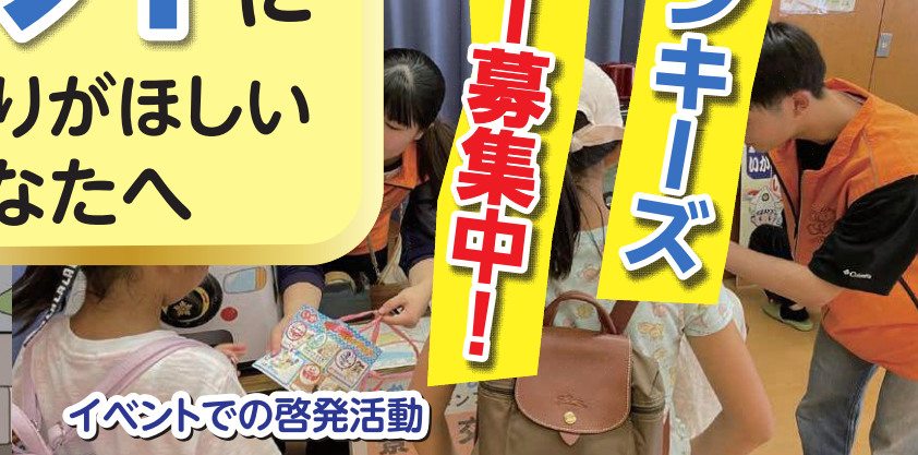
イベントでの啓発活動

ロックモンキーズって? 京都の安全・安心を支える、学生主体のボランティア団体。府警のサポートのもと、警察のイベントへの参加や学生発の企画を通して、京都に貢献する活動を行っています。約100名の学生が各地で活躍中!