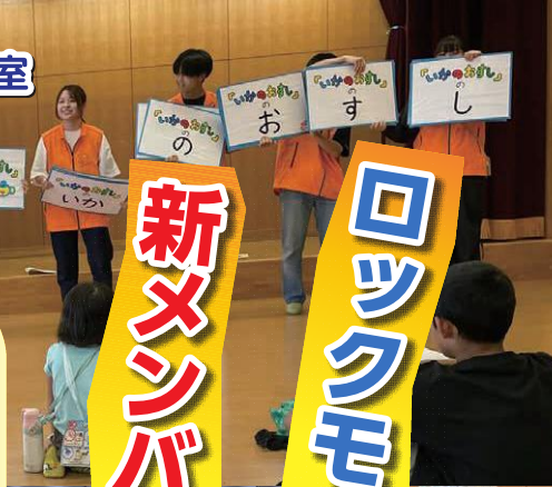
小学校で防犯教室