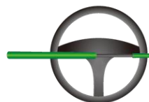
バー式ハンドルロック

油断することなく、盗難防止のために、 バー式ハンドルロック や タイヤロック を活用し、物理的に運転できないようにすることが効果的です。