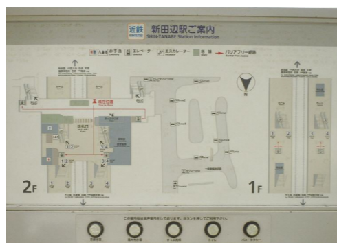
さわってわかる案内図（新田辺駅）