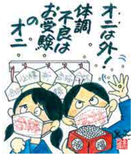
【節分(受験シーズン)】