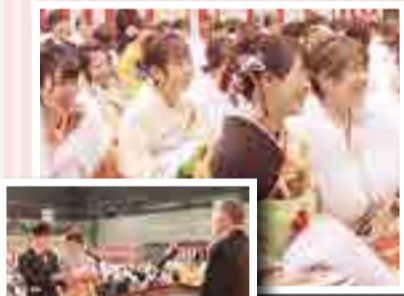
④晴れやかな表情の新成人たち⑤大人への第一歩を踏み出した喜びと決意を述べる「はたちの宣誓」

今年、市内で成人を迎えたのは844人。華やかな振り袖や真新しいスーツに身を包んだ新成人たちは、友人や恩師との再会を喜びました。また、新成人スタッフが企画した「成人のつどい」では、ピンゴ大会なども行われ、仲間と楽しいひとときを過ごしました。