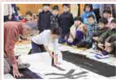
いつもより太い筆で書き初めにチャレンジする児童

同校が地元の書道名人を社会人講師として招いて行う新春の恒例行事。各学年の代表児童が大きな画仙紙に交代で一文字ずつ「お正月」「美しい空」などの課題を、丁寧に力強く書き上げました。