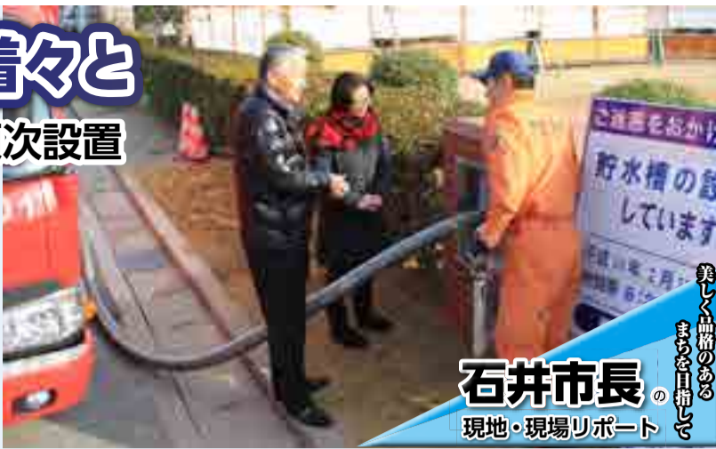
石井市長の現地・現場レポート

毎年さまざまな自然災害が発生する中、本市で最も懸念されている災害の一つが東海・東南海地震です。大規模震災では、揺れによる建物の倒壊など直接的な被害に加え、火災などの被害が甚大になるため、建物の耐震化とともに二次災害を防ぐ取り組みが重要です。