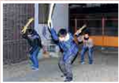
「もぐらうちおくりの歌」を歌いながら、息を合わせて何度も地面をたたき子どもたち

「おんごろ」とはモグラのこと。横槌(わらで作った棒)で地面をたたいてモグラを追い払い、今年の豊作を祈願します。子どもたちは、地域の家々を回り元気に地面をたたきました。