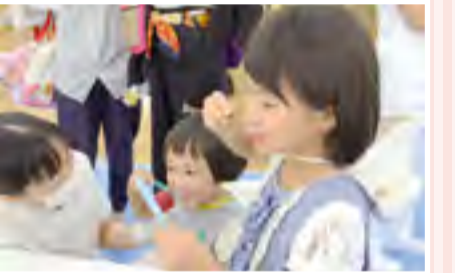
磨き残しはないかな？歯科衛生士と歯をチェック