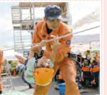
④ゴールまでもう少し！ロープを伝って移動するレスキュー訓練を体験⑤狙いを定めて！水消火器で消火体験

9月3日、消防署で「消防フェア」を開きました。たくさんの親子連れが来場し、消火・レスキュー訓練などを体験しました。また、救助隊員の訓練披露では会場から大きな歓声も。憧れの消防士になれる貴重な機会に、子どもたちは目を輝かせていました。