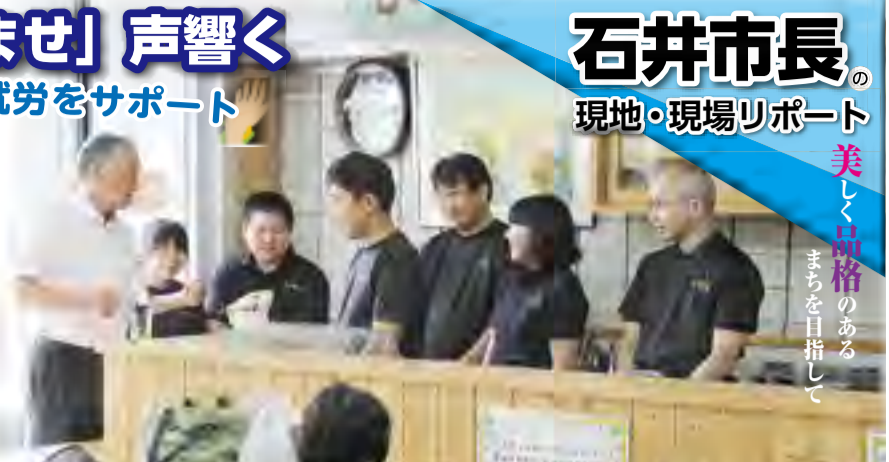
美しく品格のあるまちを目指して

市民の皆さんが集い、人がつながる場になればどの願いから、フランス語で「きずな」を意味する「りあん」と名付けられ、今では、地域交流の場としてすっかり定着しています。自立を目指して働く訓練生の皆さんに話をお伺いすると、「働くことは楽しい。もつと頑張りたい」ととても意欲的で、こうした就労の場をつくることは大切だと改めて感じました。真心込めたコーヒーを手頃な価格で楽しめる「りあん」を皆さんもぜひご利用ください。