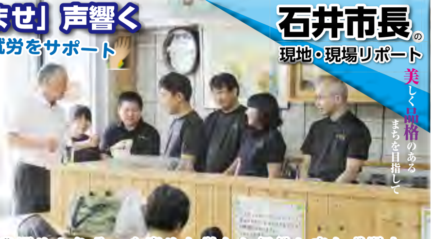
美しく品格のあるまちを目指して

市民の皆さんが集い、人がつながる場になればどの願いから、フランス語で「きずな」を意味する「りあん」と名付けられ、今では、地域交流の場としてすっかり定着しています。自立を目指して働く訓練生の皆さんに話をお伺いすると、「働くことは楽しい。もつと頑張りたい」ととても意欲的で、こうした就労の場をつくることは大切だと改めて感じました。真心込めたコーヒーを手頃な価格で楽しめる「りあん」を皆さんもぜひご利用ください。