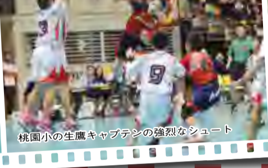
桃園小の生鷹キャプテンの強烈なシュート