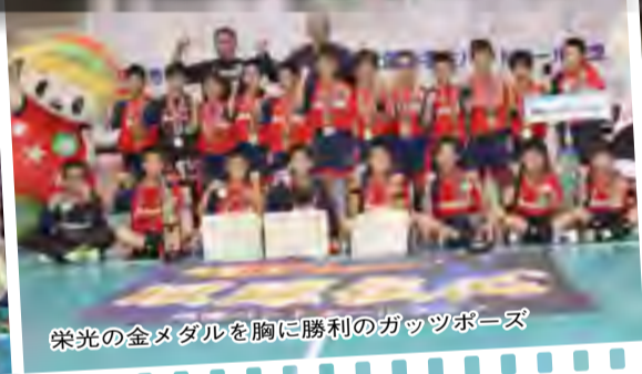
栄光の金メダルを胸に勝利のガッツポーズ