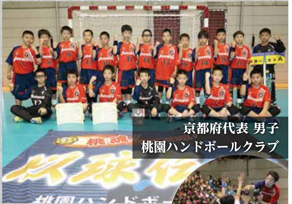
京都府代表 男子 桃園ハンドボールクラブ