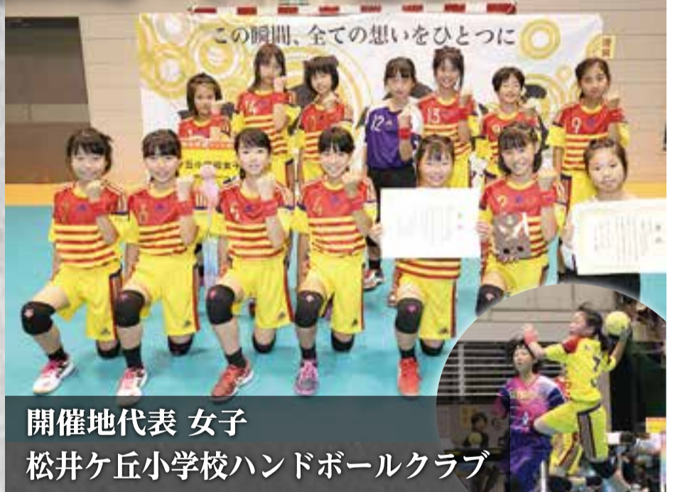
開催地代表 女子 松井ヶ丘小学校ハンドボールクラブ