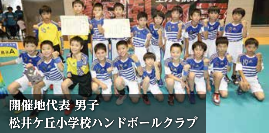
開催地代表 男子 松井ヶ丘小学校ハンドボールクラブ