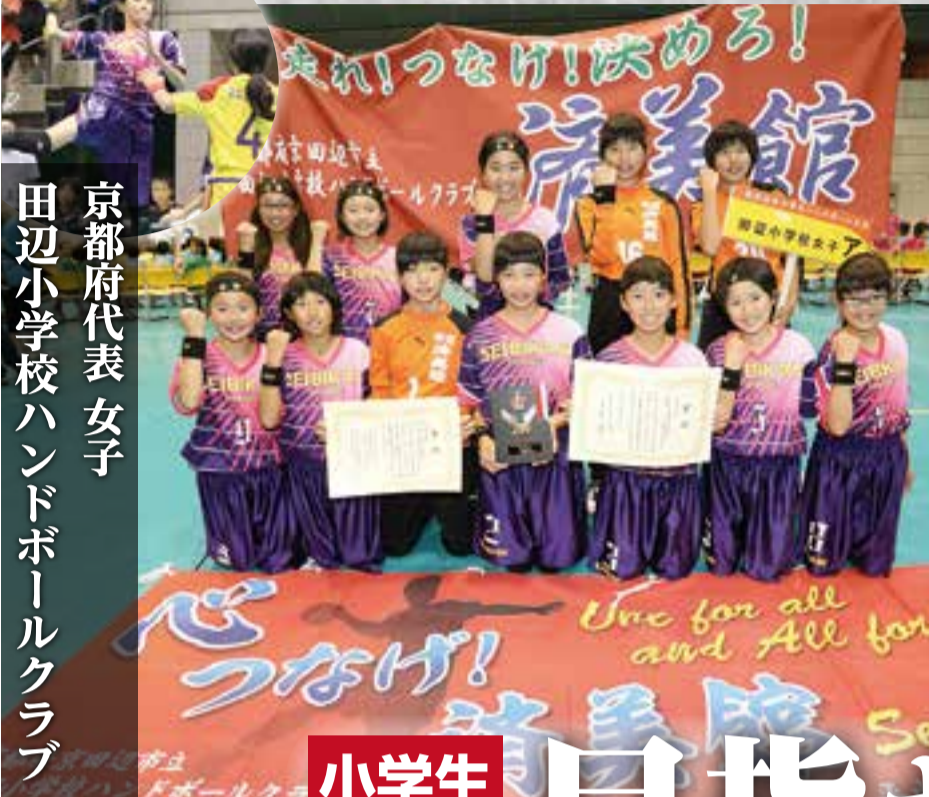
京都府代表 女子 田辺小学校ハンドボールクラブ