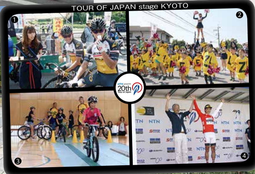
① 玉露レディが選手や観客に特産玉露をPR（普賢寺ふれあいの駅）② 普賢寺幼稚園児と同志社大学応援団チアリーダー部の学生がダンスを披露（普賢寺小学校前）③ 同日開かれた自転車教室「ウィーラースクール」（草内小学校）④ 表彰式では、石井市長が山岳賞の受賞者にレッドジャージを贈呈（けいはんなプラザ）