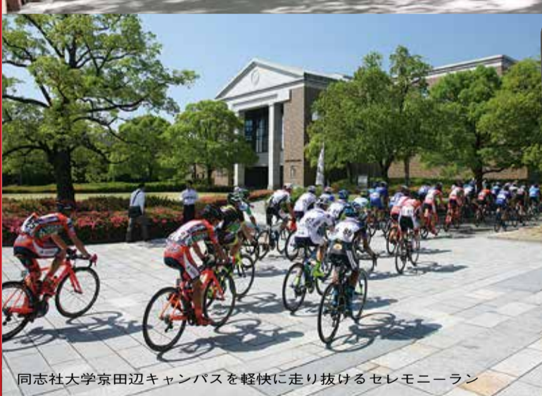
同志社大学京田辺キャンパスを軽快に走り抜けるセレモニーラン

び っくりしたのは平日にも関わらず5万人もの観客が訪れたこと。昨年引き続き観戦した人も、初めての人も、思い思いに国際的な一大イベントに酔いしれました。