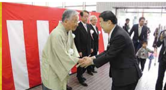
会場入口で参加者を出迎える和服姿の石井市長(写真は山田京都府知事)

5月13日、田辺中央体育館で、市制20周年記念式典が開かれました。表彰・感謝状を受ける市民をはじめ、府知事・国会議員・近隣市町村長ら約750人が出席し、京田辺市の二十歳を盛大に祝うとともに、さらなる飛躍を誓いました。