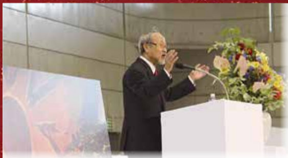
記念講演ではアフレスコ画の巨匠・絹谷幸二さんが、市庁舎に描いた壁画の思い出や子どもたちへのメッセージなどを熱く語りました