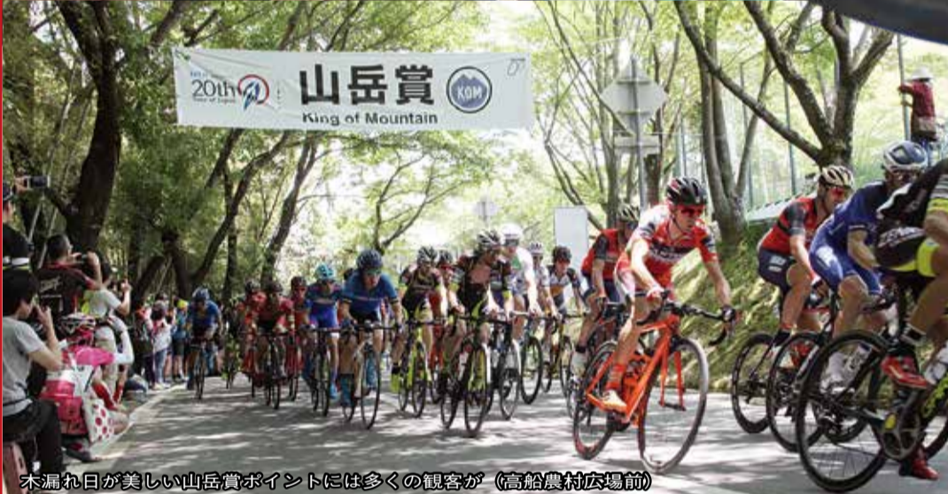
木漏れ日が美しい山岳賞ポイントには多くの観客が（高船農村広場前）

興 味の有無に関わらず、見た者はその迫力に圧倒される国際自転車ロードレース「ツアー・オブ・ジャパン」。5月22日、快晴の中、二度目となる京都ステージの火ぶたが切られました。