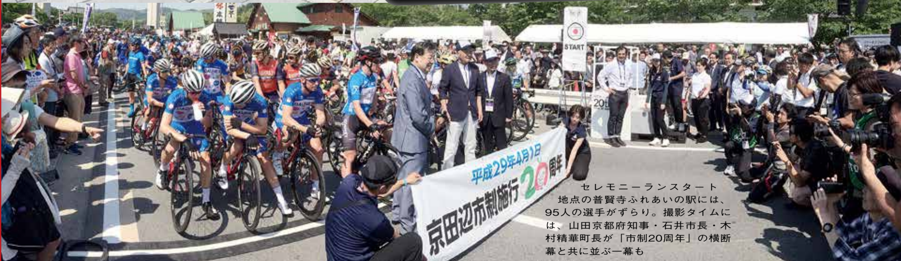
セレモニーランスタート 地点の普賢寺ふれあいの駅には、95人の選手がずらり。撮影タイムには、山田京都府知事・石井市長・木村精華町長が「市制20周年」の横断幕と共に並ぶ一幕も