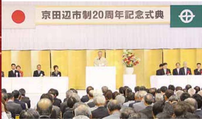
「だから、ずっと京田辺」と言っていただけで、自ら先頭に立ち、職員一丸となってまちづくりを進める」と決意を新たにす石井市長

5月13日、田辺中央体育館で、市制20周年記念式典が開かれました。表彰・感謝状を受ける市民をはじめ、府知事・国会議員・近隣市町村長ら約750人が出席し、京田辺市の二十歳を盛大に祝うとともに、さらなる飛躍を誓いました。