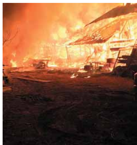
火災現場(打田地内)

問 本市の国保加入世帯は1世帯当たりの所得が昨年より8万円も減り、一方で国保会計は1億1900万円も赤字に。市民からは「医療費3割負担はきつい、国保を引き下げほしい」との声が出ているが、引き下げできないか。 市民部長 国保財源は、財政調整基金を取り崩すなど、きわめて厳しい状況にあり、国保税の引き下げは難しい。 問 青年対策として、①ブランク企業や非正規問題、学生の奨学金問題などへの市の対策は。②若者対象の相談窓口を。③高校生・大学生に憲法パンフレットの配布を。④若者の声が届く市政運営を。 健康福祉部長 ①②関係機関と連携して対応している。③国や府の関係機関が発行しているパンフレットを窓口にて設置しており、市の発行は考えていない。 市民部長 ④各種委員会に学生も参加してもらっている。 問 教職員対象のアンケートにより、長時間労働が浮き彫りになるなど「働き方の改革」が求められている。タイムカード導入やアンケートで実態を把握し改善するべき。 教育部長 校務支援システムを導入し、退勤時刻を把握している。今後も、会議の効率的な運営など、長時間勤務の改善を図っていく。 問 大住ヶ丘汚水処理場跡地の活用に対策会議の設置を。 企画政策部長 多額の撤去費用が掛かるなどの問題があり、土地の有効利用が難しい。対策会議設置は考えていない。