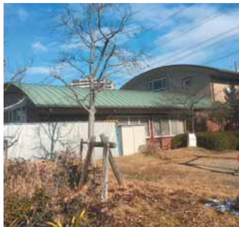
地域のコミュニティ拠点の公民館

高年齢者の見守り活動には、地域包括支援センター「あんなん」の地域包括ケア、同居高齢者等24時間見守り活動企業との連携協定などがある。さらに、区・自治会単位での見守り活動も重要となるが、個人情報保護法の関係で難しいハードルがある。行政の目から見たアドバイスや、要点はあるか。