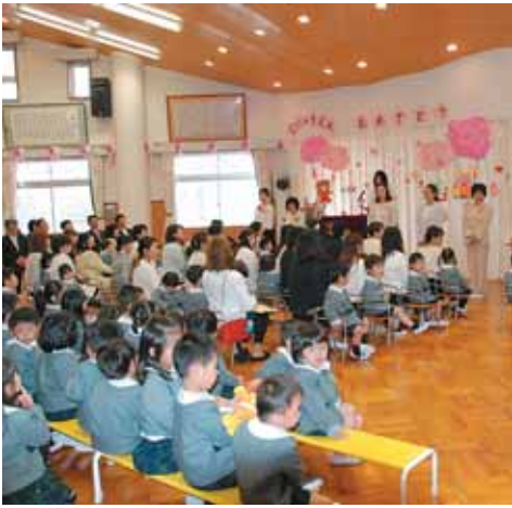
入園式 (草内幼稚園)

副市長 文科省と厚労省という違う枠組みの施策を推進することが、これによって解決できるのか。また、子ども子育て会議との関係性は。