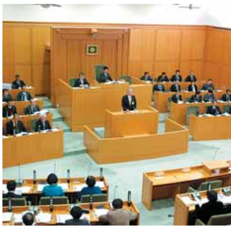
施政方針演説を行う石井市長

京田辺市議会の本会議の中継は、市議会ホームページからご覧いただけます。見られなかった方も、約1週間後には録画映像を配信いたしますので、視聴してみてください。