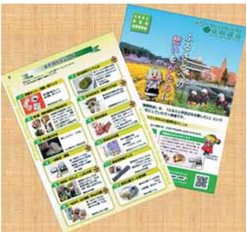
ふるさと京田辺応援寄付金のパンフレット

新たな財源の確保は、(市長) 市税等収納率の向上、市有地の売却、ふるさと京田辺応援寄付金の見直し、企業誘致と企業進出支援などの実行プログラムの推進も図る。