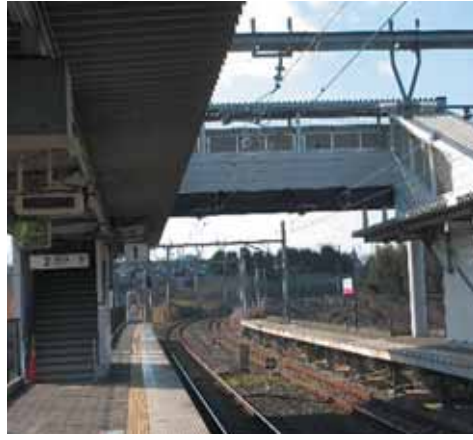
JR大住駅のホームから見た橋上通路

○ 平成29年度の施政方針は、新幹線と防災広場以外深みがない。憲法施行70年自らの一言も触れていない。防災広場は防災計画にも載っていないし、第3次総合計画にもない。憲法の男女平等に基づく女性や他の人権問題も十把一絡げの扱いだ。新幹線の誘致も市民がどれだけの費用負担をするのか。 (市長) 施政方針に書いていないことも、職員と一丸となりやっています。書いていないという問題ではない。 ○ それでは何のための施政方針かと逆に問いたい。 夜間中学校に関する法律ができ、文科省は手引書も作成した。府へ働きかけるとともに市独自で京都市立洛友中学校に直接働きかけるべき。 (健康福祉部長) 実人数を改めて調査する。