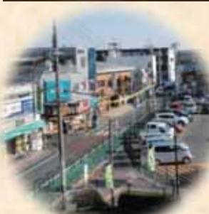
商店が並ぶ新田辺駅東側