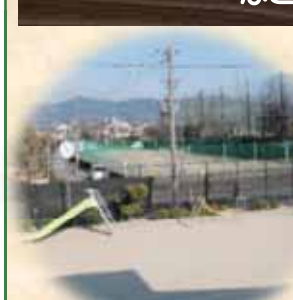
河原保育所園庭(手前)と仮設園舎予定地(奥)