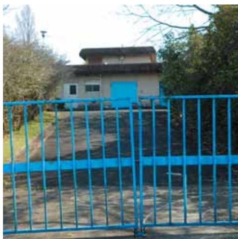
大住ヶ丘汚水処理場跡地