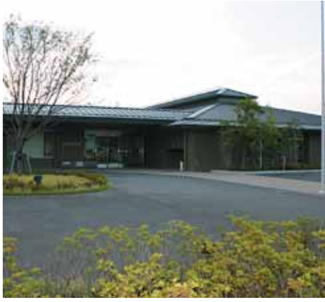
宝生苑と大住児童館がある 大住ふれあいセンター