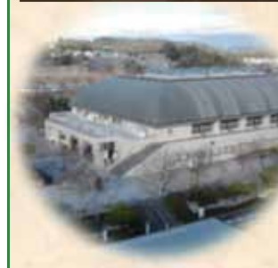
築30年が経過する 中央体育館