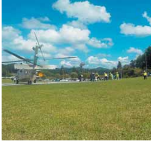
ヘリコプターによる物資輸送訓練 (府総合防災訓練)

災害時の防災拠点となる防災広場は、本市が被災した時だけでなく、近隣地域で大規模災害が発生した時でも大きな役割を果たすと考える。その規模や設置する施設、平時の活用方法は、(市長) 京奈和自動車道田辺西インター西側で、大規模災害時に救済物資の受け入れ等ができる、約5haの防災広場を整備する。緊急援助隊などの活動拠点、ヘリポート、救済物資の集積場、水・食料等の備蓄倉庫の整備を計画。平時は、市民のスポーツ、レクリエーションなど、多目的な広場として活用を考えている。平成29年度に用地を取得、31年度は造成工事に着手、35年度には基本機能の整備を計画している。