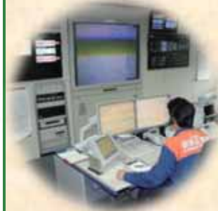
消防活動の要となる 通信指令システム