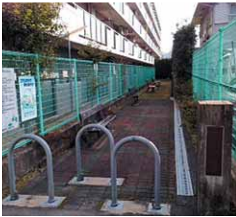
河原北口第一公園

○ JR大住駅にエレベーターの設置を。 (市長) JRに早期設置を要請し、平成32年までの設置を目指す。 ○ 子どもたちの通学路に防犯カメラの設置を。 (教育部長) 子どもたちの安全確保や犯罪の抑止等について、他市の事例を研究したい。 ○ 市庁舎玄関に防犯カメラの設置を。 (総務部長) 29年度に、庁舎出入り口全てに設置を予定。 ○ 府は29年度予算に、胃がん予防のためピロリ菌検査と除菌治療助成費を計上した。本市も導入する考えは。 (健康福祉部長) 府の内視鏡検査でのピロリ菌陽性者に対する除菌治療助成と、高校生1年生に対するピロリ菌検査支援事業に、市も協力していきたい。市が実施するピロリ菌検査については、他市の状況を注視して検討したい。 ○ 28年、国において自転車活用推進法が成立した。市は自転車専用道路の整備を進めているが、今後の予定は。 (建設部長) 府が進める京都茶いぐるみラインやT.O.Iのコースにおいて、車道の端に自転車誘導ラインの設置、路面標示を実施し、整備を図る。 ○ 公共交通の補完や観光戦略として、レンタル自転車事業の整備を進める考えは。 (建設部長) 近鉄新田辺駅前で、指定管理者によるレンタル事業を実施している。近鉄三山木駅やJR松井山手駅など、鉄道駅周辺での民間駐輪場事業者にも意見を聞きたい。