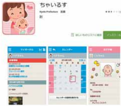
京都府の子育て支援サイト「ちやいるす」