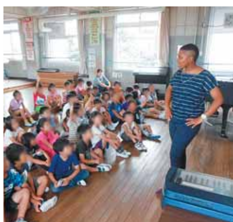
A L Tによる外国語活動の様子 (田辺小学校)

①「全国大学まちづくり政策フォーラム(京田辺)」の積極的な市施策への活用は、②今回から市民サポーターの参画がなくなった理由は。