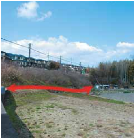
市道認定を行った山手東上西野線 (宝生苑側の延伸部分)