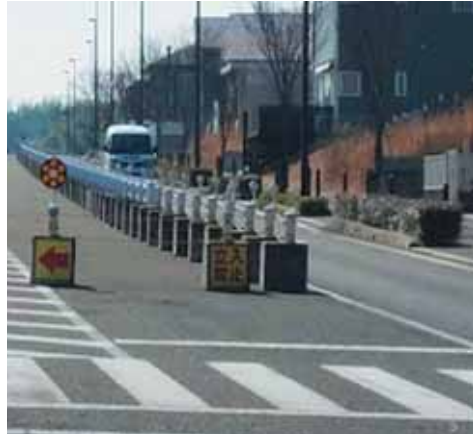
同志社山手北バス停前の交差点 (信号機設置前)

○ 介護の課題。①介護難民が高齢者・障がい者ともに増加している。市の現状認識と課題は。②視覚障がいと認定されると白杖が支給されるが、現在、その使い方を講習は実施されず、ガイドヘルプも受けることができない。ガイドヘルプは事業所報酬が低いことも一因。上乗せ支給をするなど外出支援の対策を。 (健康福祉部長) ①いずれも認識。高齢介護は平成29年度よりデイサービスの選択肢を増やす。また、両者とも、30年度からの次期計画策定に向けて、ニーズの把握を行ない、整備の方向性やニーズに対応した供給方針について検討する。②白杖歩行はライトハウスなど専門機関が訪問訓練を実施。その周知に努める。事業所報酬は給付事業のため、上乗せは難しい。近隣市町村の意見を聞く中で、府を通じて要望できるのか検討する。 ○ 公園の課題。①以前の条例・法律の中で設置された街区公園の中には、形状が細長く面積が極端に小さいものがある。また、遊具が植栽で覆われている、砂場に草が生い茂っているなど管理も不十分。改善と定期的な管理を。②花見山公園の野外ステージは非常に利用率が低い。規定を見直すなど改善を求める。 (建設部長) ①街区公園の形状改善の要望は聞いていない。日常的な管理は地元区や自治会にお願いしているが、高木町については市が4年に1回実施。②平均年約4回の利用。利用促進を進める。