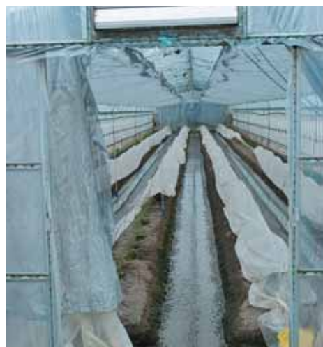
施設園芸のビニールハウス (田辺地内)

問 平成27年度において過労死があった。残業を減らす工夫を考えているのか。 総務部長 時間外勤務の削減は、職員の健康管理の点で重要と認識している。削減目標を立てて、長時間勤務を防止する取り組みを行っている。 問 教育部社会教育・スポーツ推進課に対し、残業削減対策を提言したが、現状は。 教育部長 業務効率化や意識改革で一層の削減に努めている。 問 過労死の危険性を熟知しているのか。 総務部長 時間外勤務が多い職員には、産業医や保健師による健康相談や面接指導などを行い、働きやすい職場づくりを進めている。 問 今後、ますます増える空き家への対策が必要と考えるが、倒壊の恐れがある空き家に対し、行政代執行(取り壊し)をした事例はあるか。 建設部長 実施事例はない。 問 空き家バンクシステムや、市外からの入居に限り、リノベーション一部支援システムの条例等を構築しては。 建設部長 議員提案の空き家バンクや改修支援も、選択肢として検討したい。 問 南部住民センターの必要性の認識と、実現のめどは。 市長 文化振興計画や立地適正化計画に基づいて、しっかりとやしていきたい。 問 山間地での火災に対し、消防水利が不足していないか。 消防長 消防水利の設置基準は満たしているが、さらなる確保は重要であり、今後も研究する。