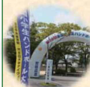
小学生の熱い夏が来る