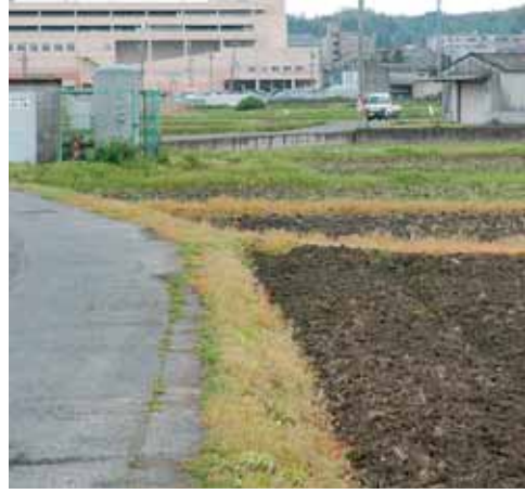
コンパクトシティが計画されている 田辺中央北側用地