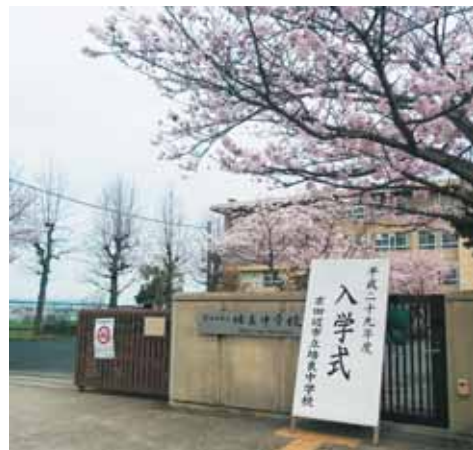
新入生を迎える培良中学校