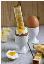
Eggs and Soldiers

4月16日(日)は「イースター」というキリストが復活したことを祝う記念日です。新しい命を表すことから、朝食に卵を食べる人々が多いです。この日、私の実家では伝統的な卵料理、「Eggs and Soldiers」を食べます。「Eggs and Soldiers」とはバターを塗り、スライスしたトースト(soldiers=軍人)を半熟卵(egg)に付けて食べることで