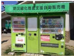
防災支援自動販売機

その後、防賀川公園で休憩をとっている際、イギリスでは地震がほとんどないと話をすると驚いたガイドの方は、ここで整備された災害支援の施設を紹介してくれました。特に感心したのは災害時、自動的にドリンクを無料で提供する自動販売機でした。